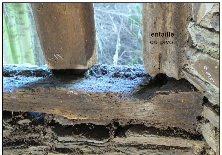
Fig. 2.6. Appui (angle droit)