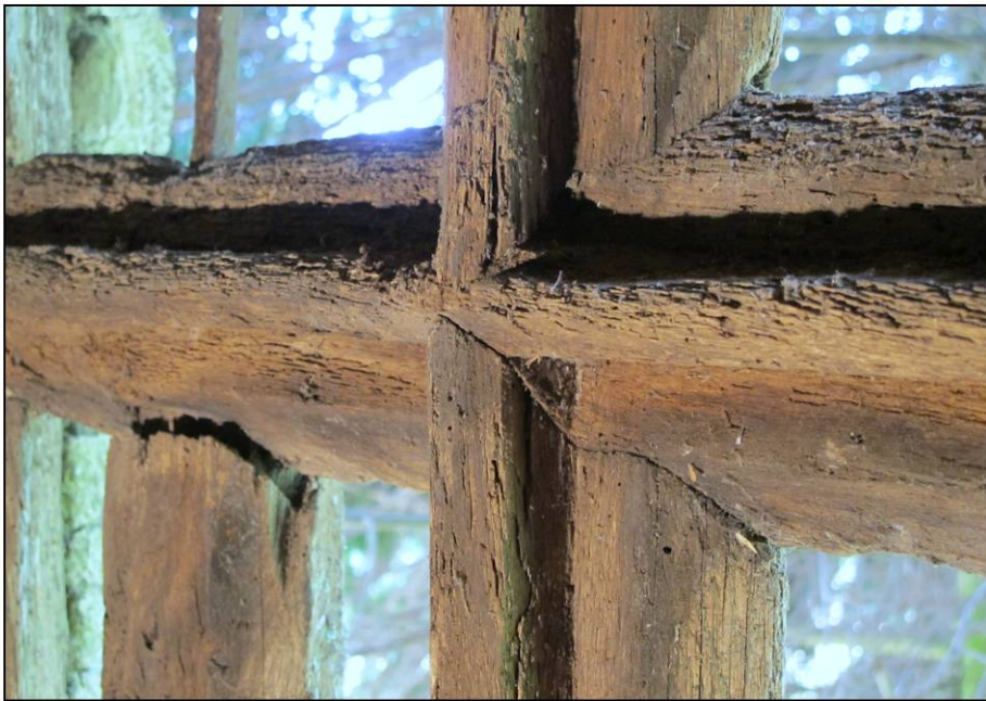
Fig. 2.3. Assemblage du meneau et du croisillon