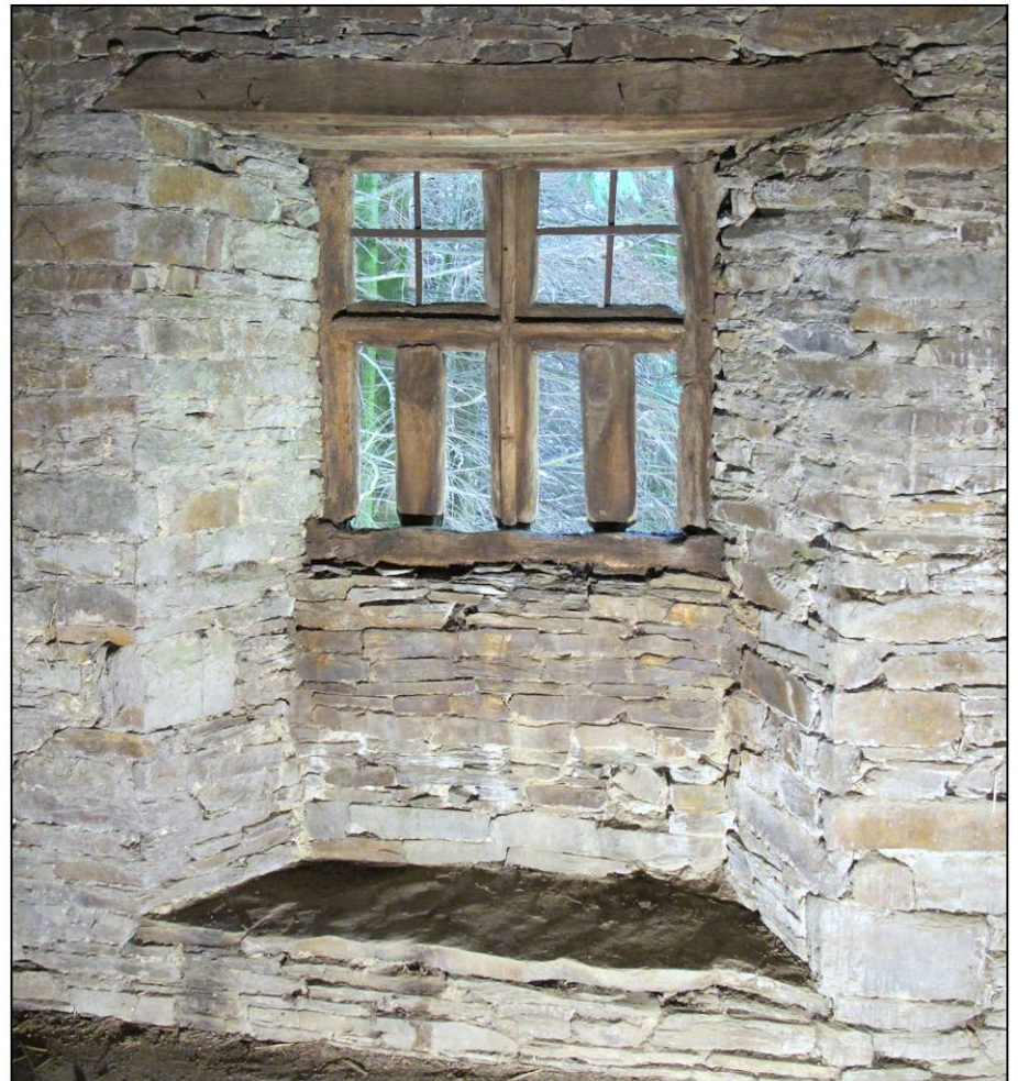
Fig. 2.4. Embrasure intérieure