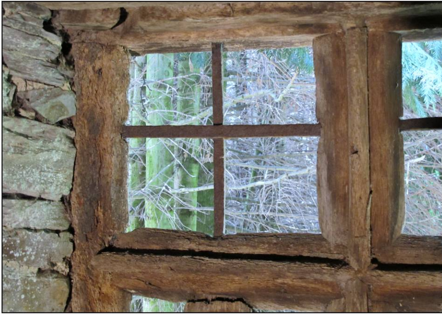
Fig. 2.1. Compartiment supérieur gauche