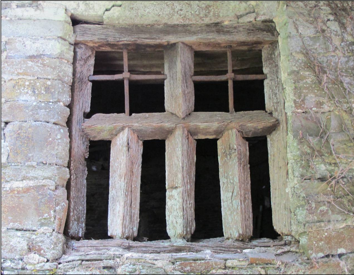
Fig. 1.1. Croisée (élévation extérieure)