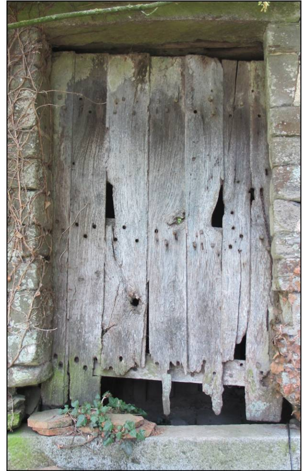
Fig. 1.2. Porte ouest