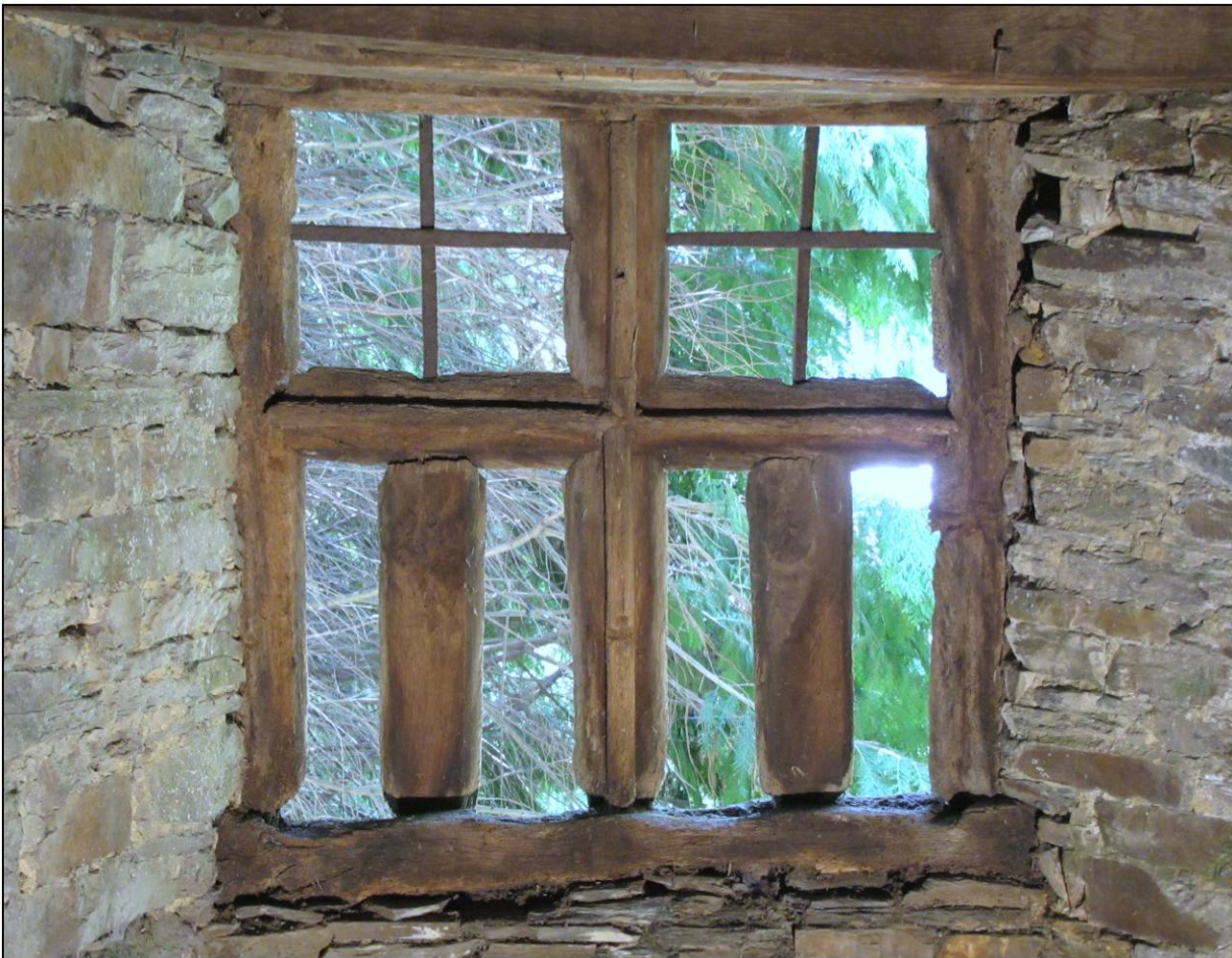
Fig. 1.3. Croisée (élévation intérieure)