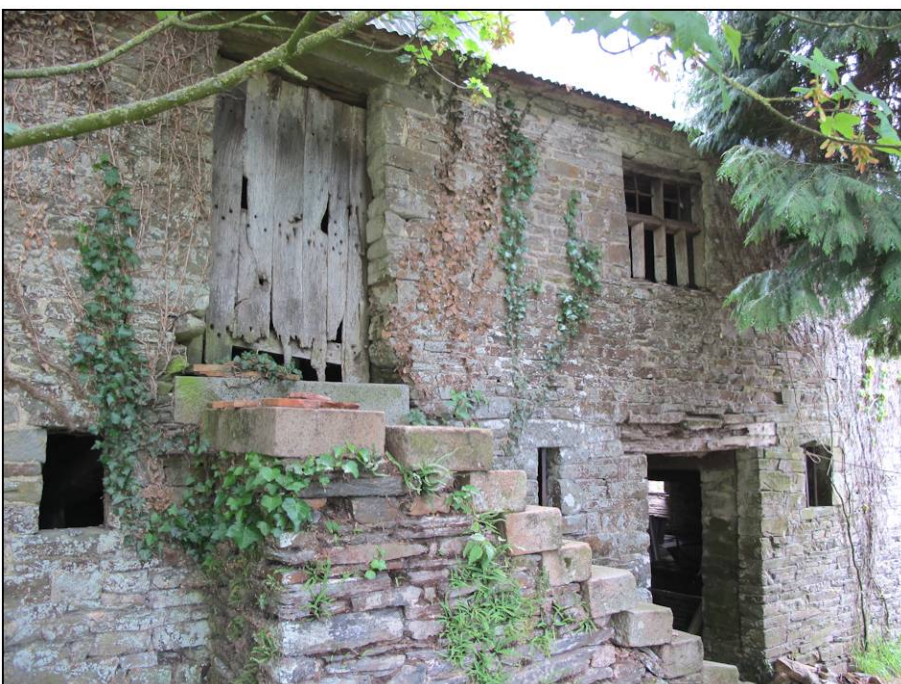
Fig. 1.5. Façade ouest