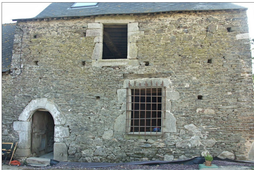
Fig. E.1. La façade antérieure en 2006, avant restauration.

Les volets du bas reprennent le même mode de fabrication, même s'ils sont séparés par une traverse intermédiaire qui délimitait, avant leur modification, deux panneaux superposés. On retrouve ici la façon de constituer les bâtis de traverses et surtout de montants d'une largeur exceptionnelle qui laissent peu de place aux panneaux, comme au manoir de la Ville-ès-Marquer à Bléruais (étude n°35001), au logis du Bas-Canlou à Iffendic (n°35002) ou aux manoirs de Kerduel à Lignol (n°56002) et de la Cour à Gourhel (n°56004). On bat toutefois ici des records, un montant ayant jusqu'à 189 mm. Le menuisier semble avoir privilégié une largeur unique des panneaux, quelle que soit leur position (panneaux du haut 220 mm / bas 226 mm). Ces largeurs considérables permettent bien évidemment de constituer des bâtis rigides qui résistent aux intempéries et de garantir leur équerrage en réduisant la longueur des traverses. Les bâtis des croisées bretonnes montrent parfois des fluctuations importantes (cf. étude n°56004). Ce n'était pas le cas ici. Malgré les remaniements, il a été possible de retrouver la section d'origine des éléments des volets et de montrer leur régularité. Au-delà de la simple restitution graphique qui a permis de remettre en cohérence les