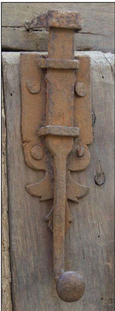
Fig. 1.3. Verrou