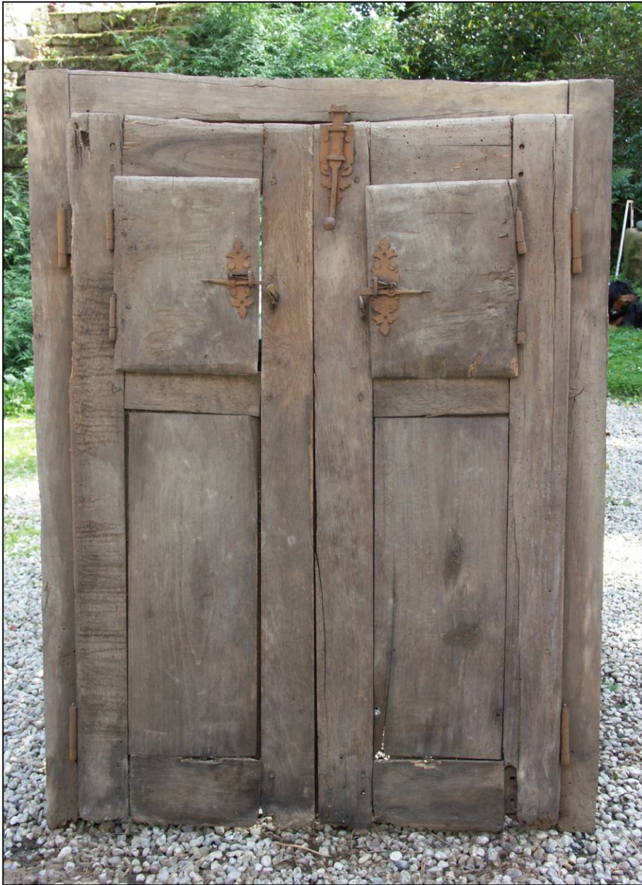
Fig. 1.1. Elévation intérieure