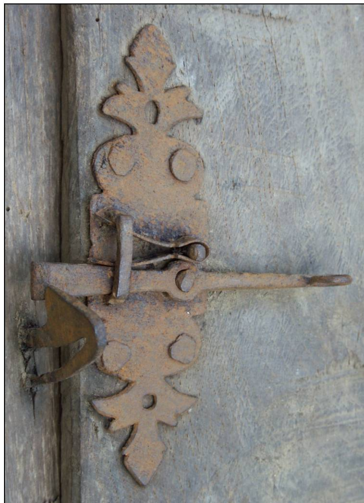
Fig. 1.4. loquet