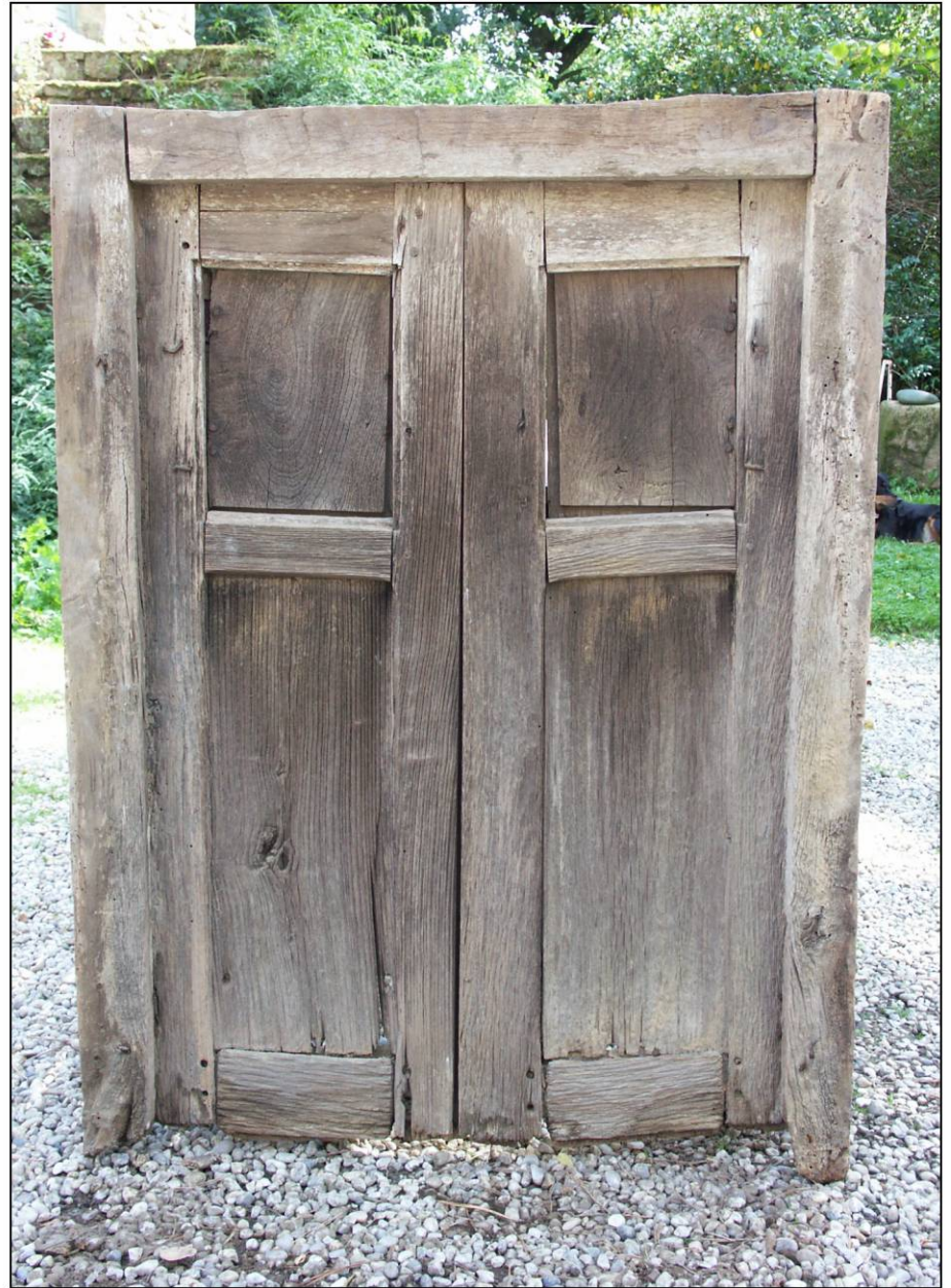
Fig. 1.2. Elévation extérieure