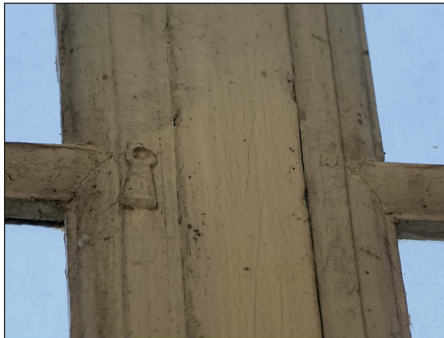
Fig. 2.2. Loqueteau (vantaux vitrés supérieurs)