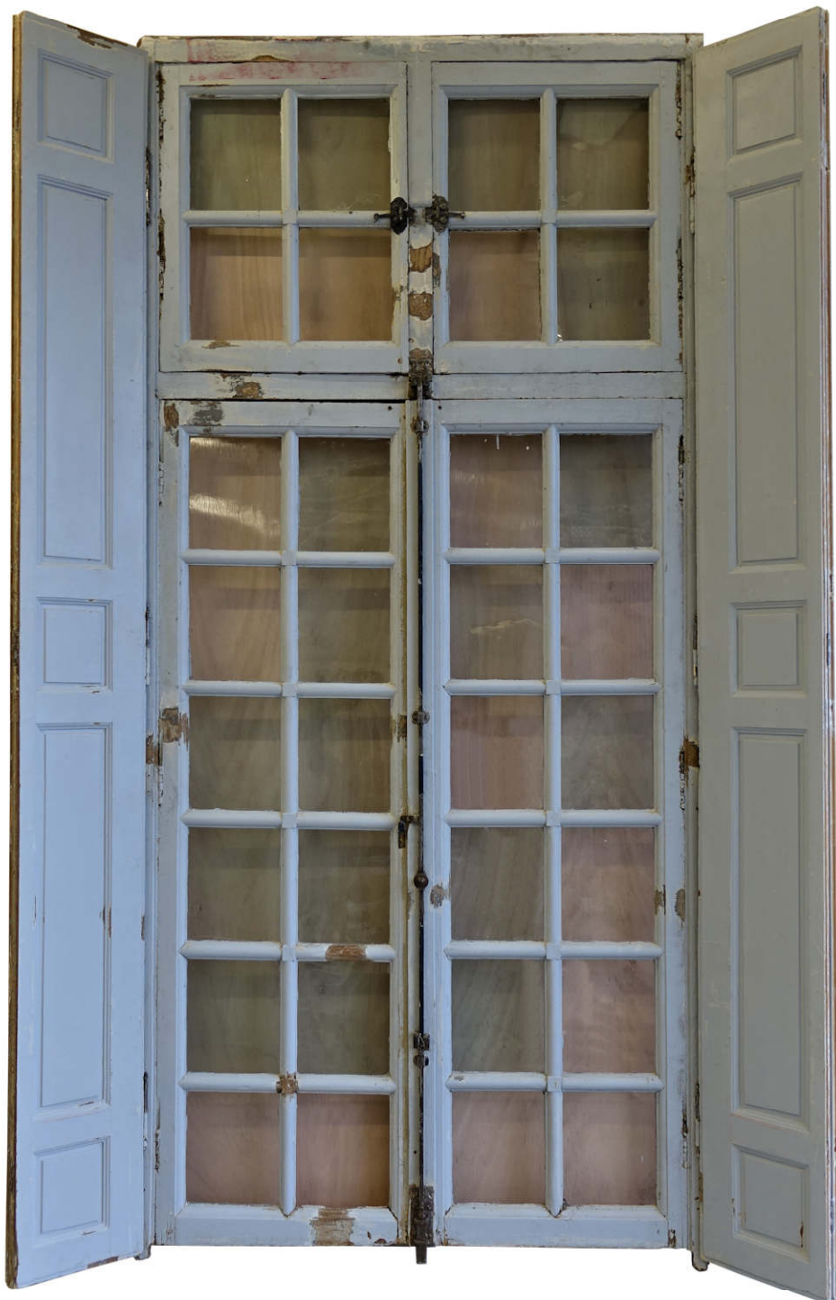
Fig. 2.1. Elévation intérieure