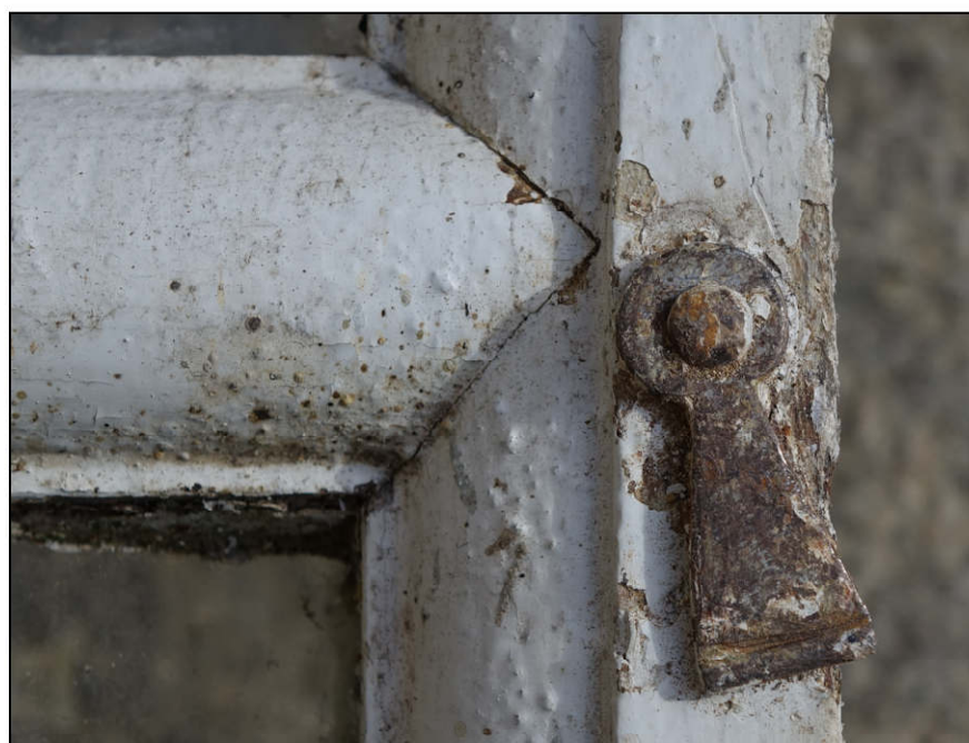
Fig. 2.3. Loqueteau