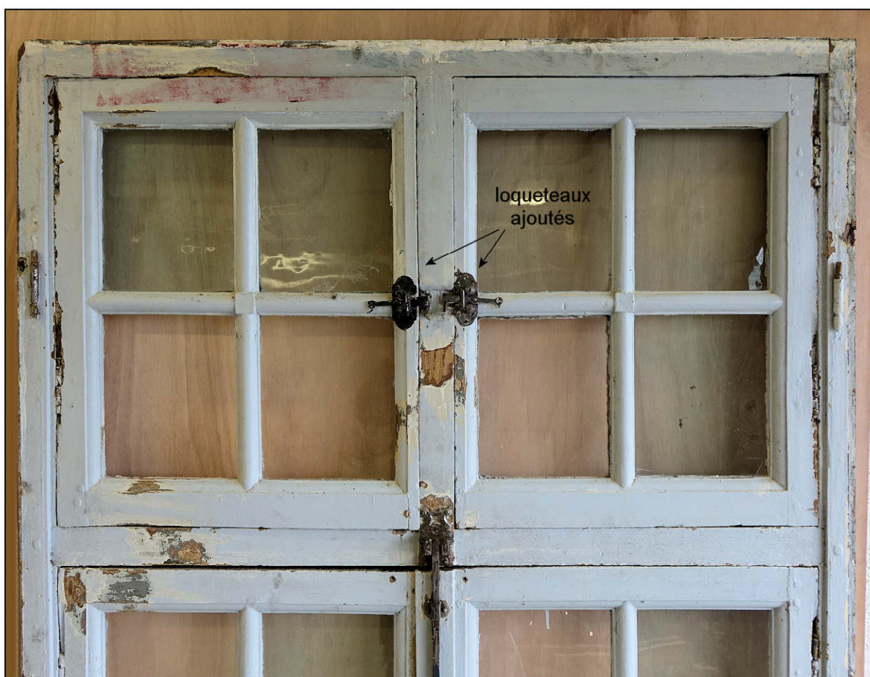
Fig. 2.4. Imposte