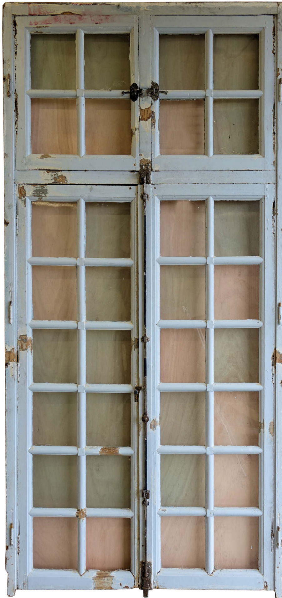
Fig. 1.2. Élévation intérieure