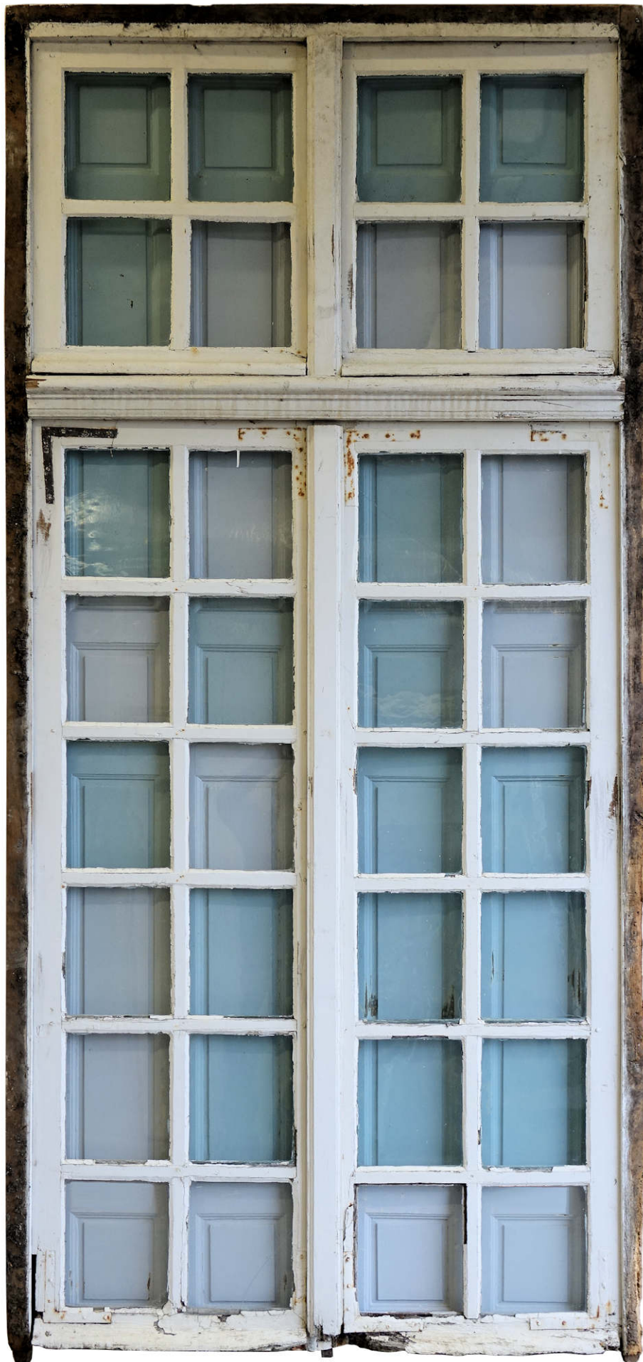
Fig. 1.1. Élévation extérieure