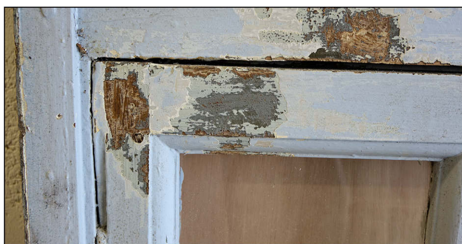
Fig. 1.4. Vantail vitré inférieur gauche