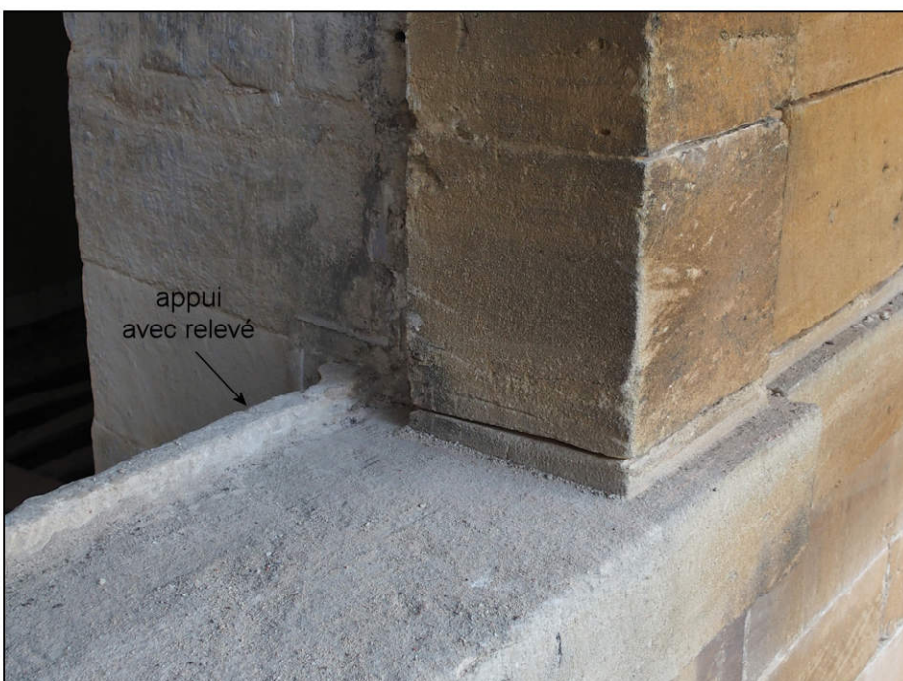
Fig. 9.7. Appui avec relevé en pierre (aile ouest / façade est)