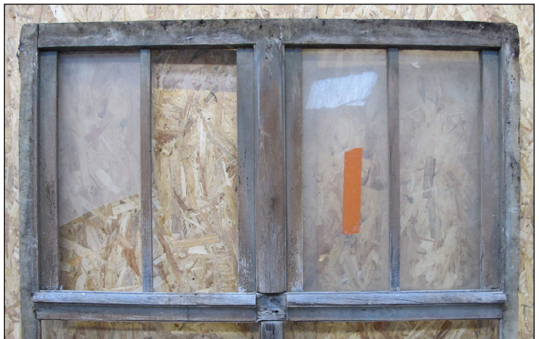
Fig. 9.6. Compartiments supérieurs / extérieur (croisée J)