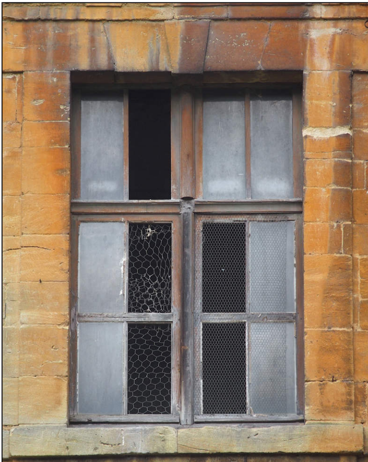
Fig. 9.5. Croisée J