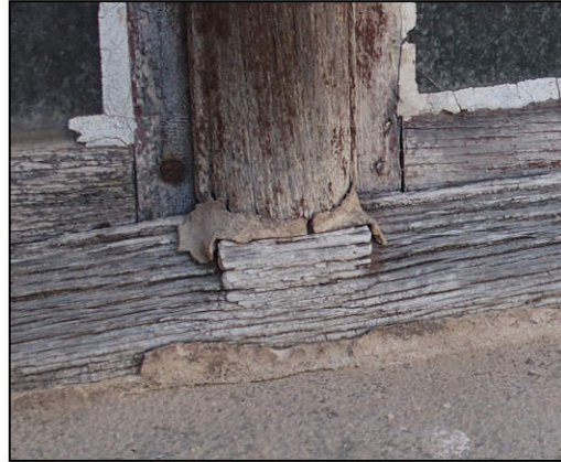
Fig. 9.2. Pièce d'appui (I)