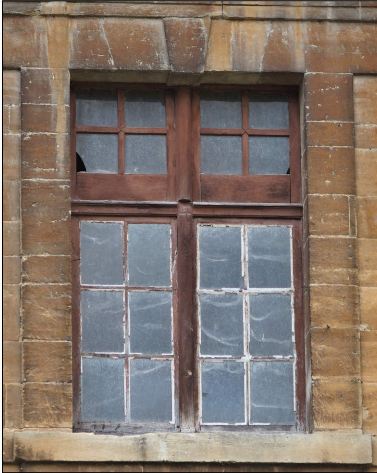
Fig. 9.1. Croisée I