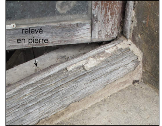
Fig. 9.3. Appui et pièce d'appui (I)