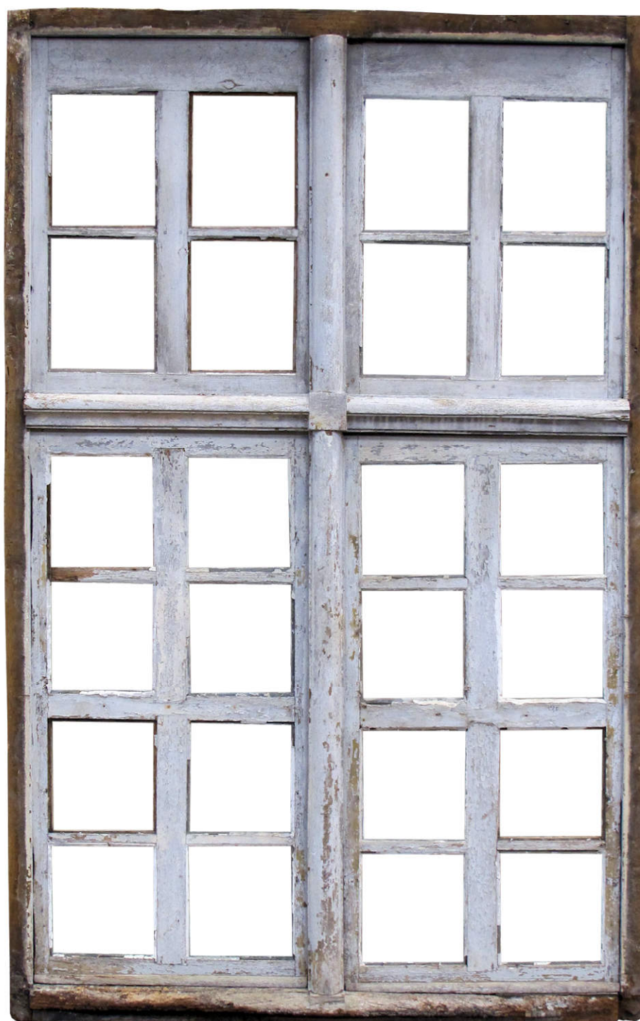
Fig. 3.2. Elévation extérieure