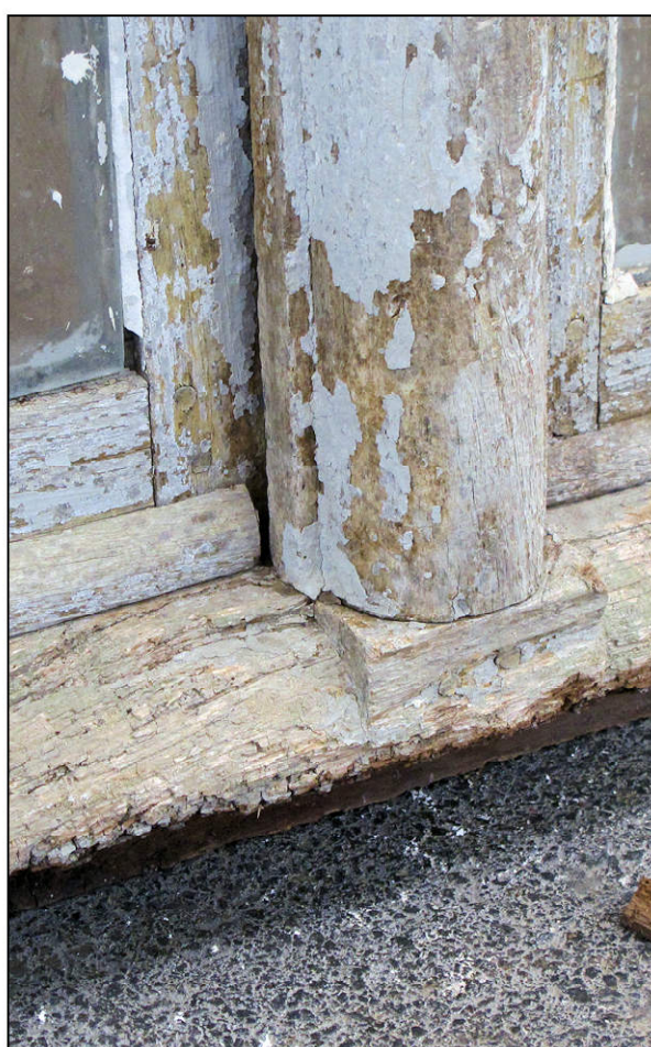
Fig. 3.4. Assemblage meneau / pièce d'appui