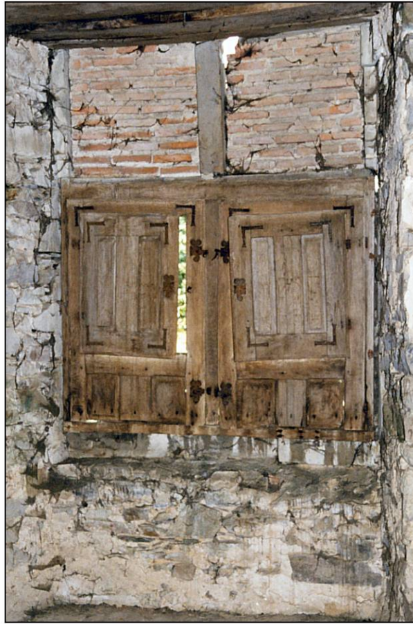
Fig. 1.2. Fenêtre