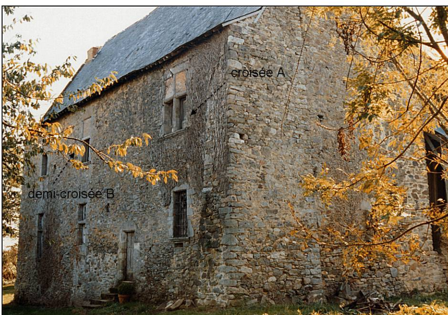
Fig. 1.5. Façade nord et pignon ouest