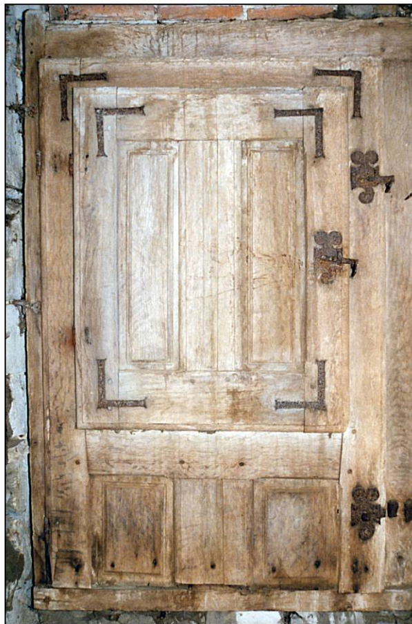
Fig. 1.4. Compartiment inférieur gauche