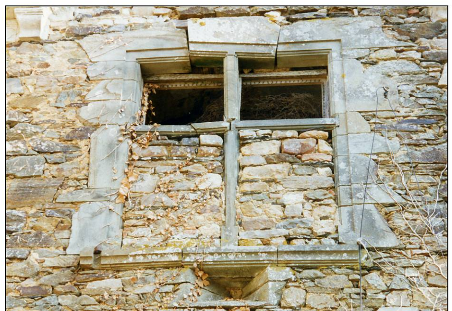
Fig. 1.6. Fenêtre (façade sud)