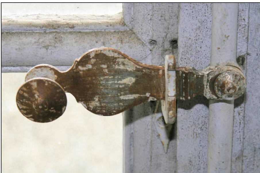
Fig. 4.6. Façade sud (niveau 1 / fenêtre 6 / espagnolette)