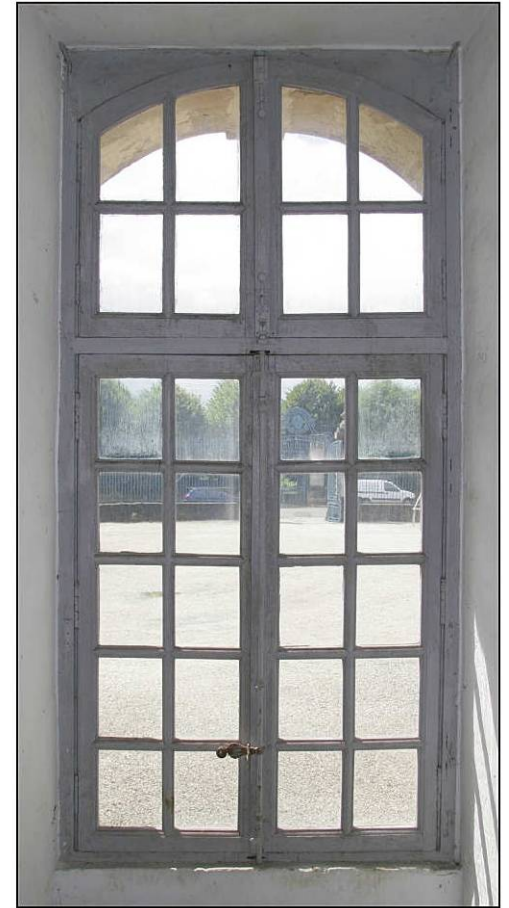
Fig. 4.3. Façade sud (niveau 1 / fenêtre 6)