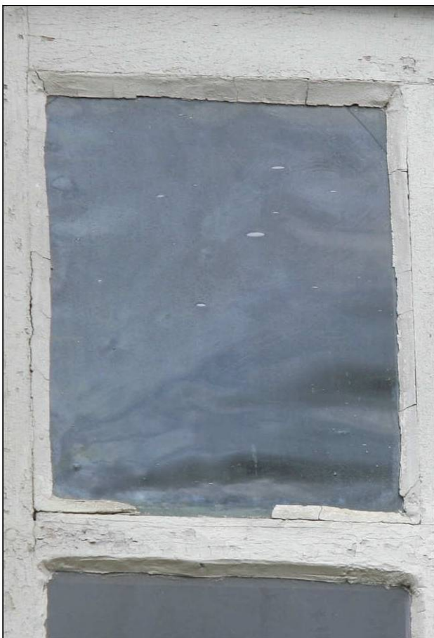
Fig. 4.4. Façade sud (niveau 1 / fenêtre 6)