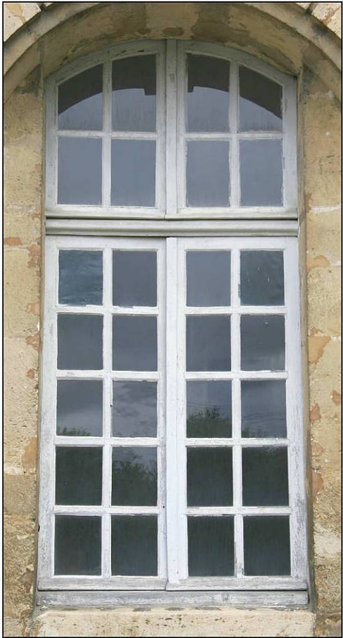
Fig. 4.1. Façade sud (niveau 1 / fenêtre 6)