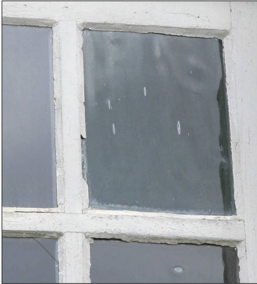
Fig. 4.2. Façade sud (niveau 1 / fenêtre 6)