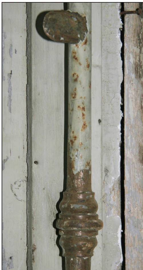
Fig. 3.5. Espagnolette (embase)