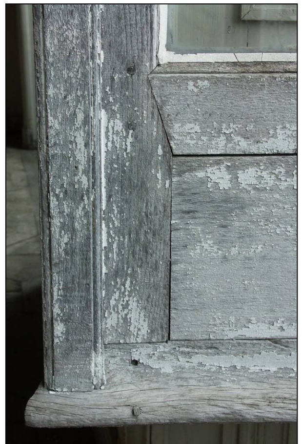
Fig. 3.6. Battant du milieu et jet d'eau