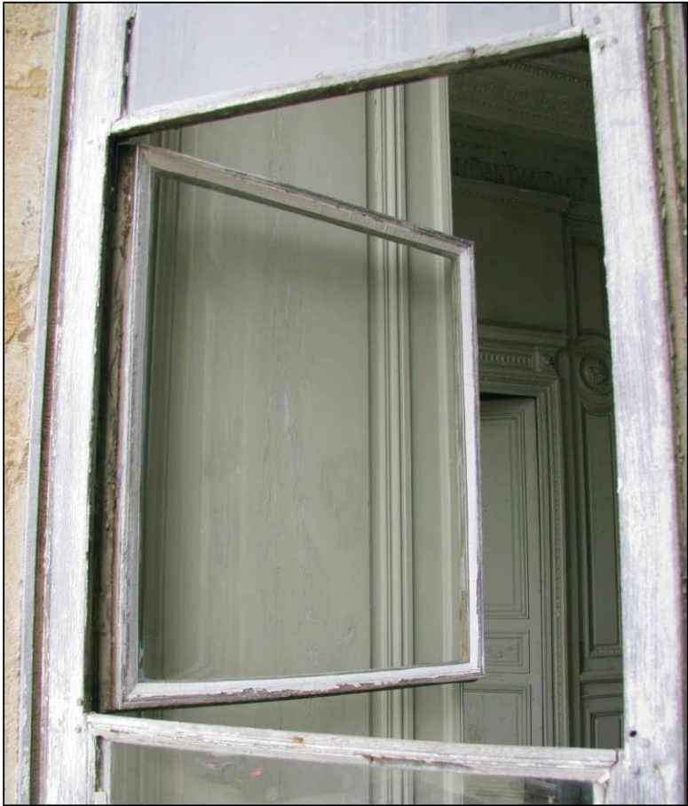
Fig. 3.1. Façade sud (niveau 2 / fenêtre 5)