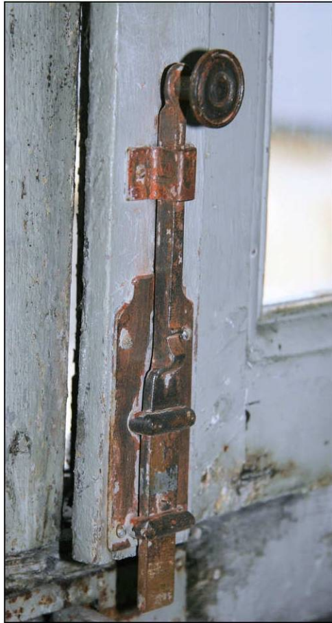
Fig. 3.2. Verrou (vantaill supérieur)