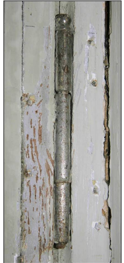
Fig. 3.3. Fiche (vantaill inférieur)