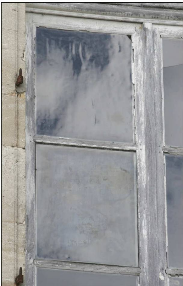
Fig. 3.4. Façade sud (niveau 2 / fenêtre 6)