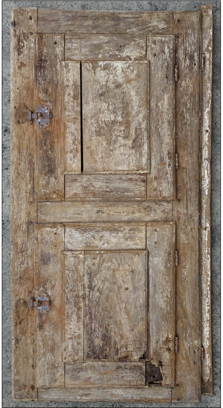
Fig. 3.2. Elévation intérieure