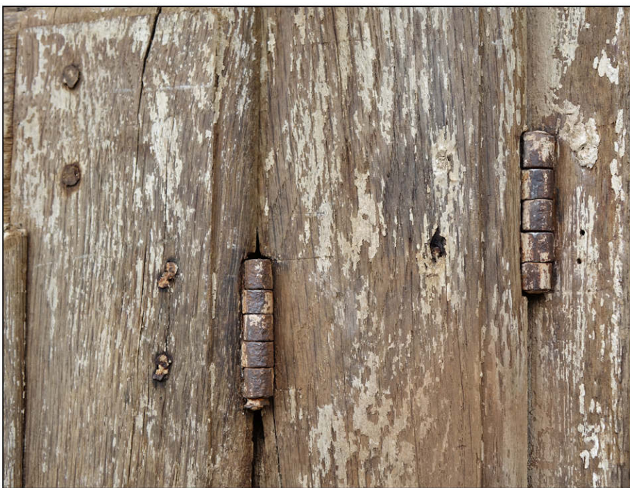
Fig. 3.3. Fiches