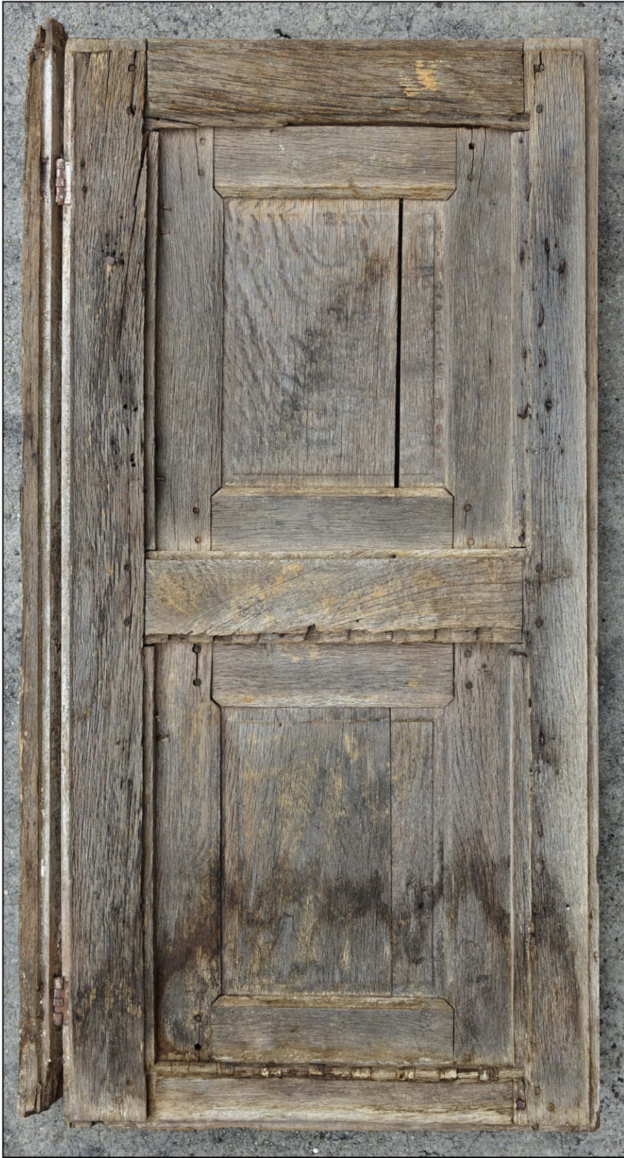
Fig. 3.1. Elévation extérieure