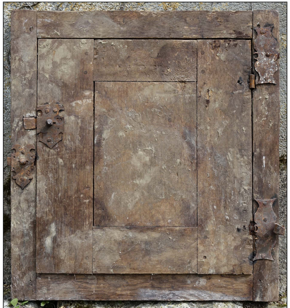
Fig. 2.4. Vue intérieure