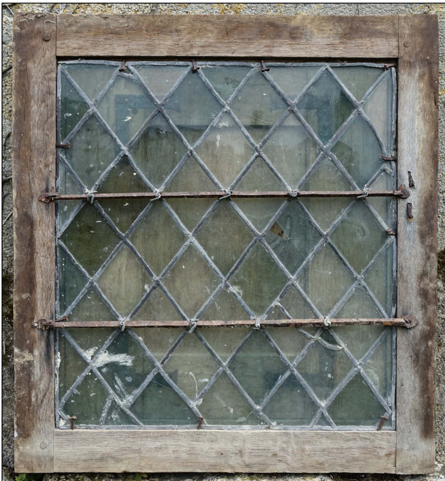
Fig. 2.3. Vue extérieure