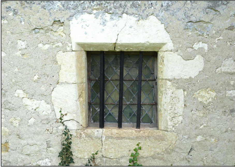
Fig. 2.1. Vue extérieure de la fenêtre