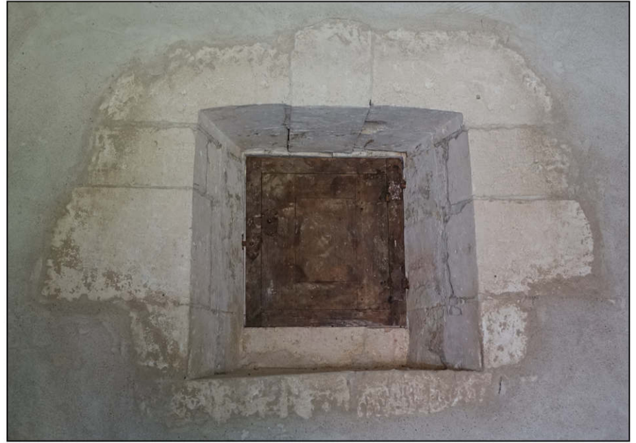
Fig. 2.2. Vue intérieure de la fenêtre