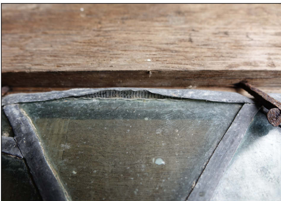
Fig. 2.5. Vitrierie (plomb strié)