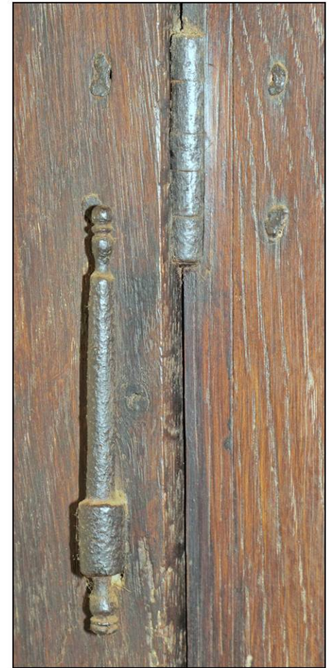
Fig. 1.3. Fiches