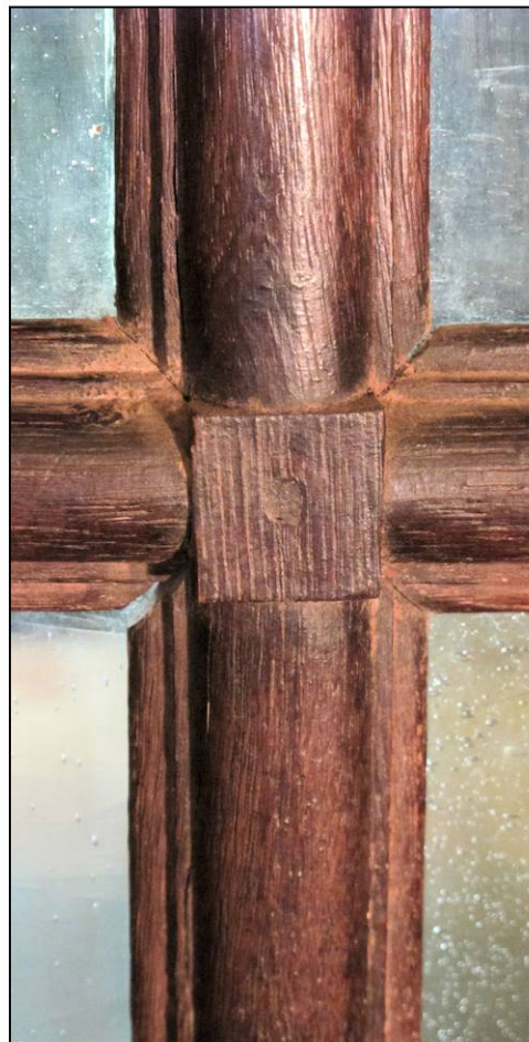
Fig. 1.5. Assemblage à petite plinthe