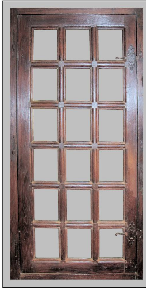
Fig. 1.2. Elévation intérieure