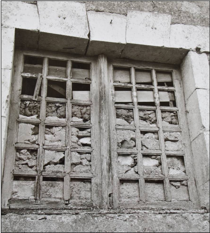
Fig. 1.1. Elévation extérieure