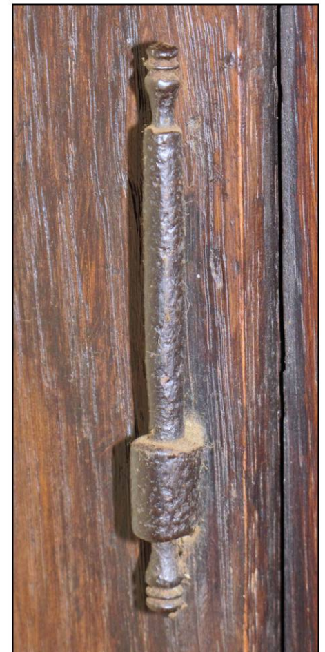
Fig. 1.6. Fiche à gond