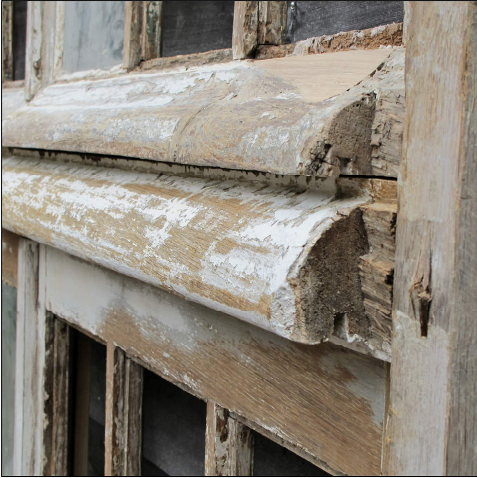
Fig. 2.1. Imposte (A)