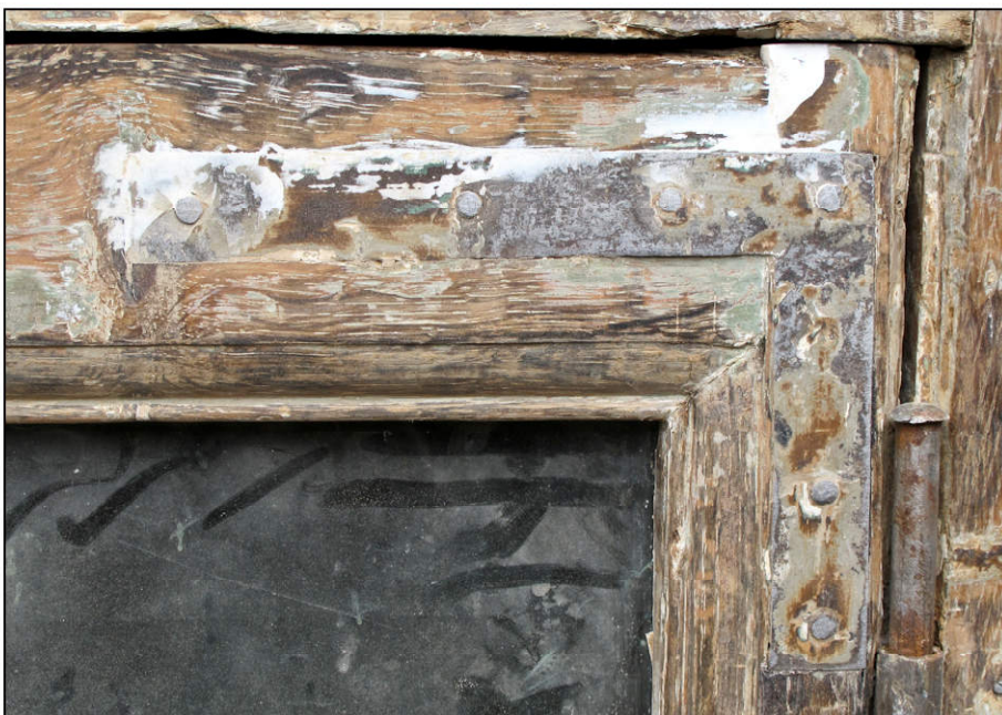
Fig. 2.6. Equerre (A)