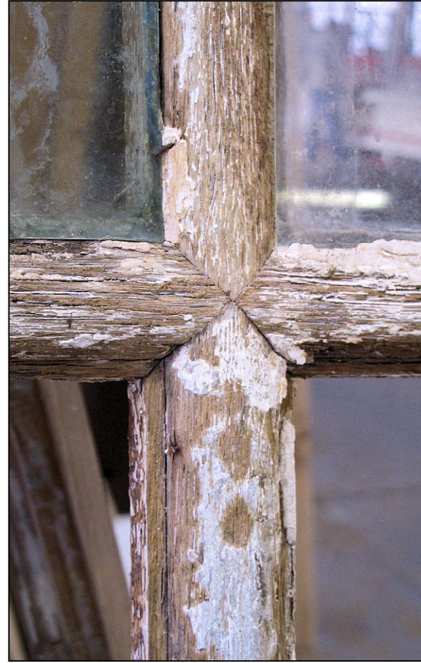
Fig. 2.2. Petits-bois (B)