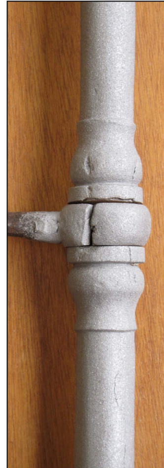
Fig. 2.5. Espagnolette (A)