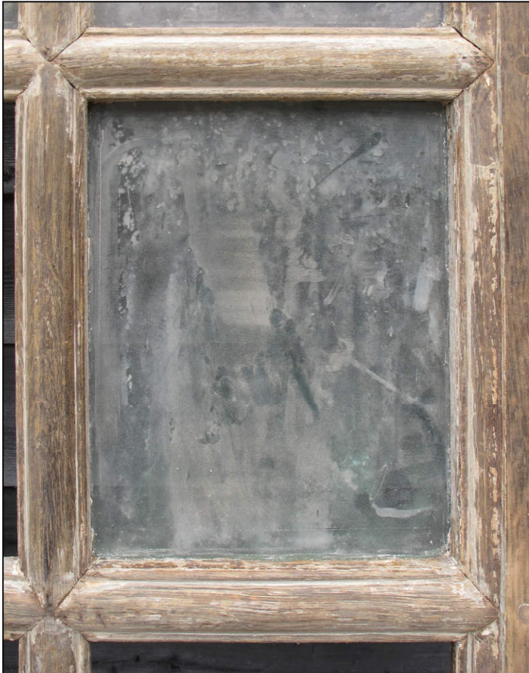
Fig. 2.3. Petits-bois (A)