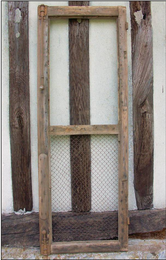
Fig. 2.1. Vantail vitré inférieur (intérieur)