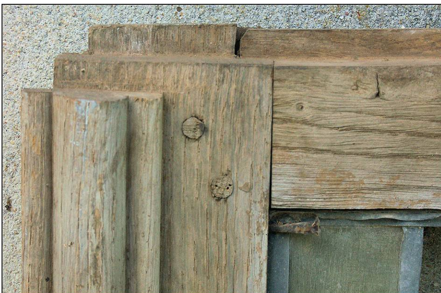
Fig. 2.5. Vantail vitré supérieur (couvre-joint mouluré)