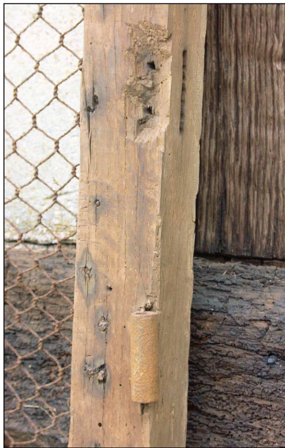
Fig. 2.4. Vantail inf. (modification du ferrage)