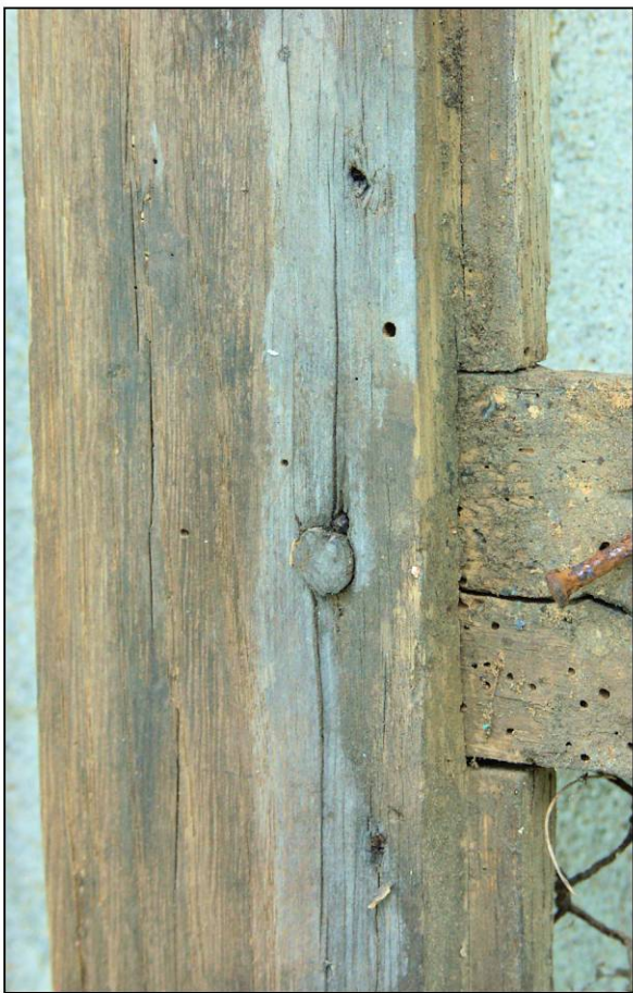
Fig. 2.3. Vantail inf. (traverse intermédiaire)