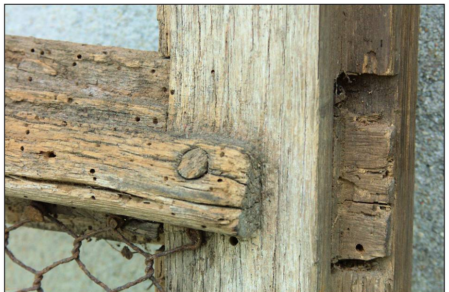
Fig. 2.6. Vantail vitré inférieur (traverse intermédiaire flottée)