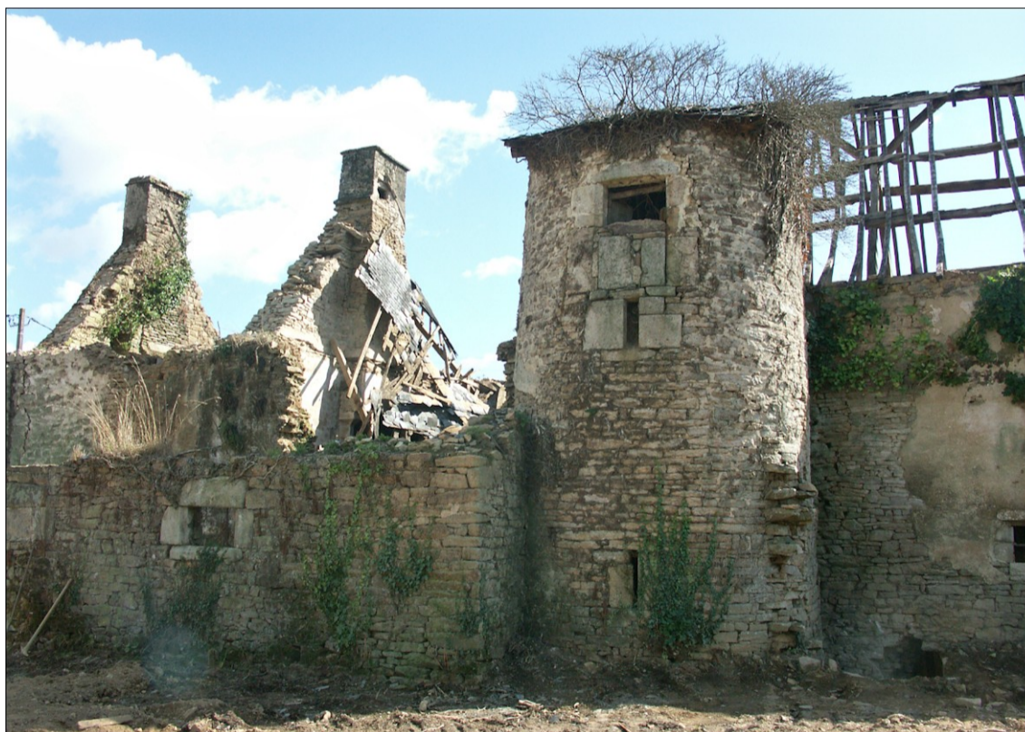
Fig. E.1. Le manoir en 2006, avant restauration.

Les volets adoptent deux types différents. Ceux du haut sont traditionnellement montés à recouvrement alors que ceux du bas sont encastrés plus profondément et n'ont pas de recouvrement, mais simplement une légère saillie sur le bâti dormant (plan n°3). Nous n'avons pas d'arguments certains pour expliquer ce changement de parti entre le registre du haut et celui du bas. Il pourrait être dû au réemploi de pentures à charnière mal adaptées à des bâtis à recouvrement, mais il ne s'agit là que d'une hypothèse impossible à vérifier. Hormis ce détail, la conception de ces volets est la même. Ils sont constitués d'un bâti fait d'éléments de fort équarrissage qui laissent peu de place au panneau central (plan n°1). Sur les croisées de ce type, le battant du côté des fiches est généralement le plus large. C'est le cas ici sur le volet du haut alors que c'est l'inverse sur celui du bas. Les panneaux sont arasés à l'intérieur et à glace à l'extérieur. Les bâtis sont simplement moulurés de chanfreins arrêtés et la jonction entre les volets du bas est assurée par un battement à feuillure. Il n'y a donc aucune recherche de décoration particulière sur ces volets et seule la robustesse semble compter.