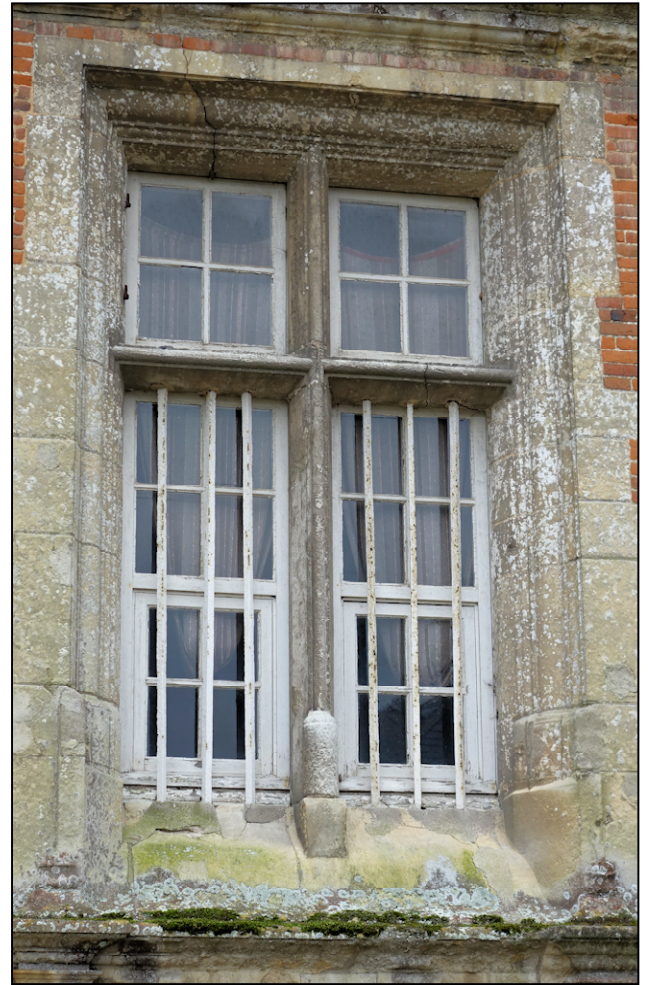
Fig. 9.2. Croisée 4