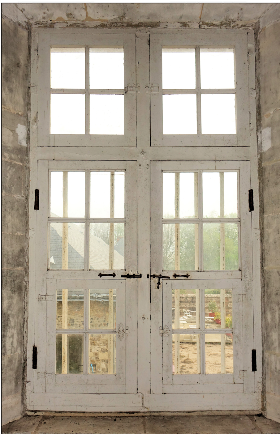
Fig. 9.3. Croisée 4