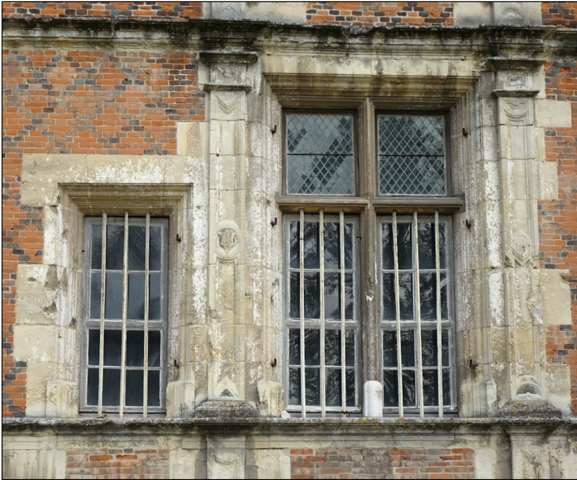
Fig. 9.1. Châssis 2 et croisée 3