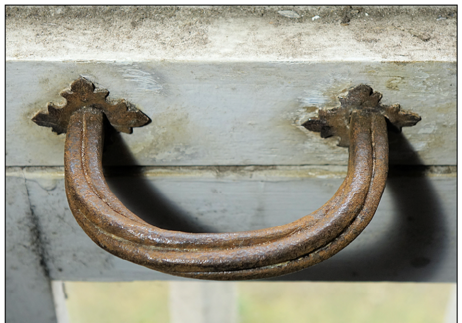
Fig. 9.5. Poignée (croisée 4)