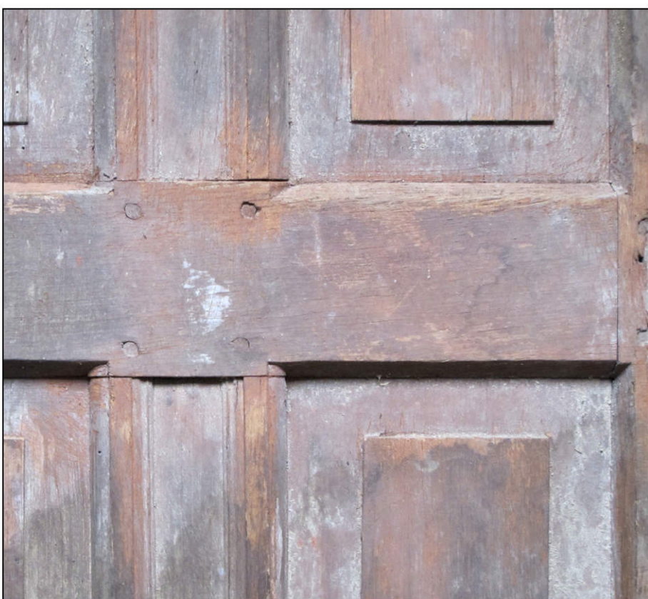
Fig. 6.3. Détail de la mouluration (croisée)