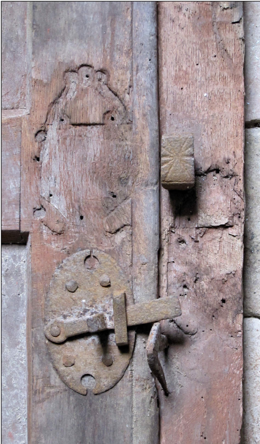
Fig. 6.1. Entailles des platines des targettes