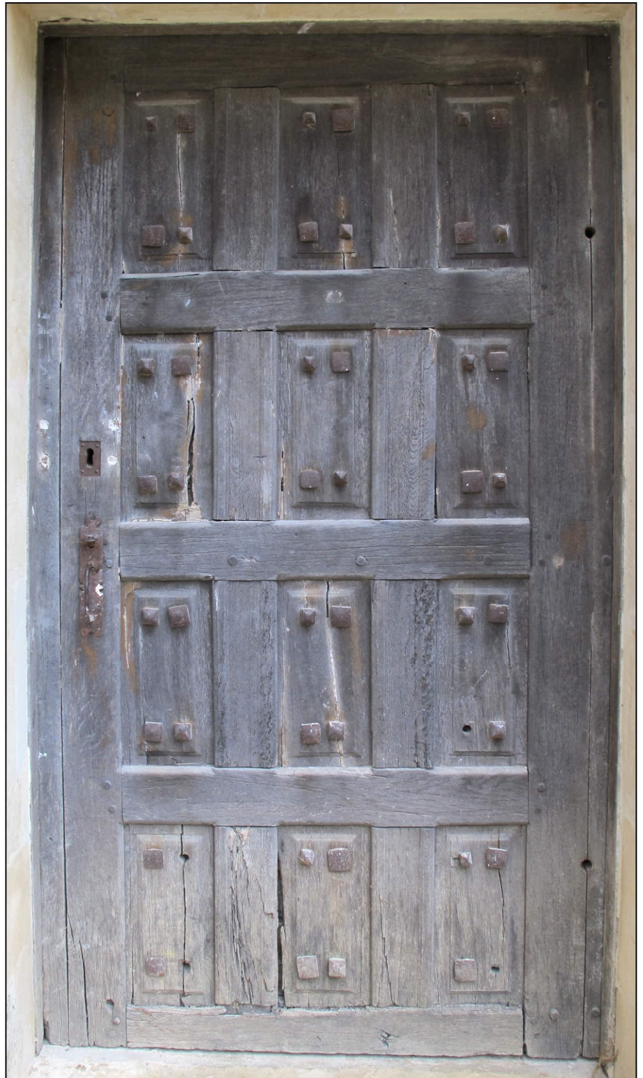
Fig. 6.2. Porte (élévation extérieure)