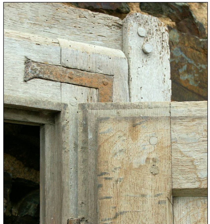
Fig. 4.4. Recouvrement des bâtis