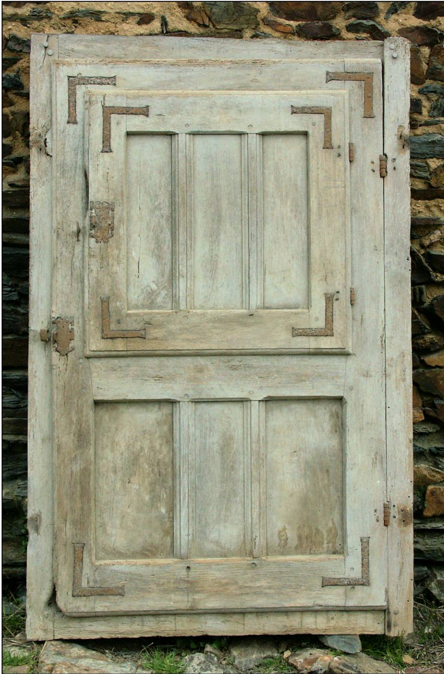
Fig. 4.1. Elévation intérieure