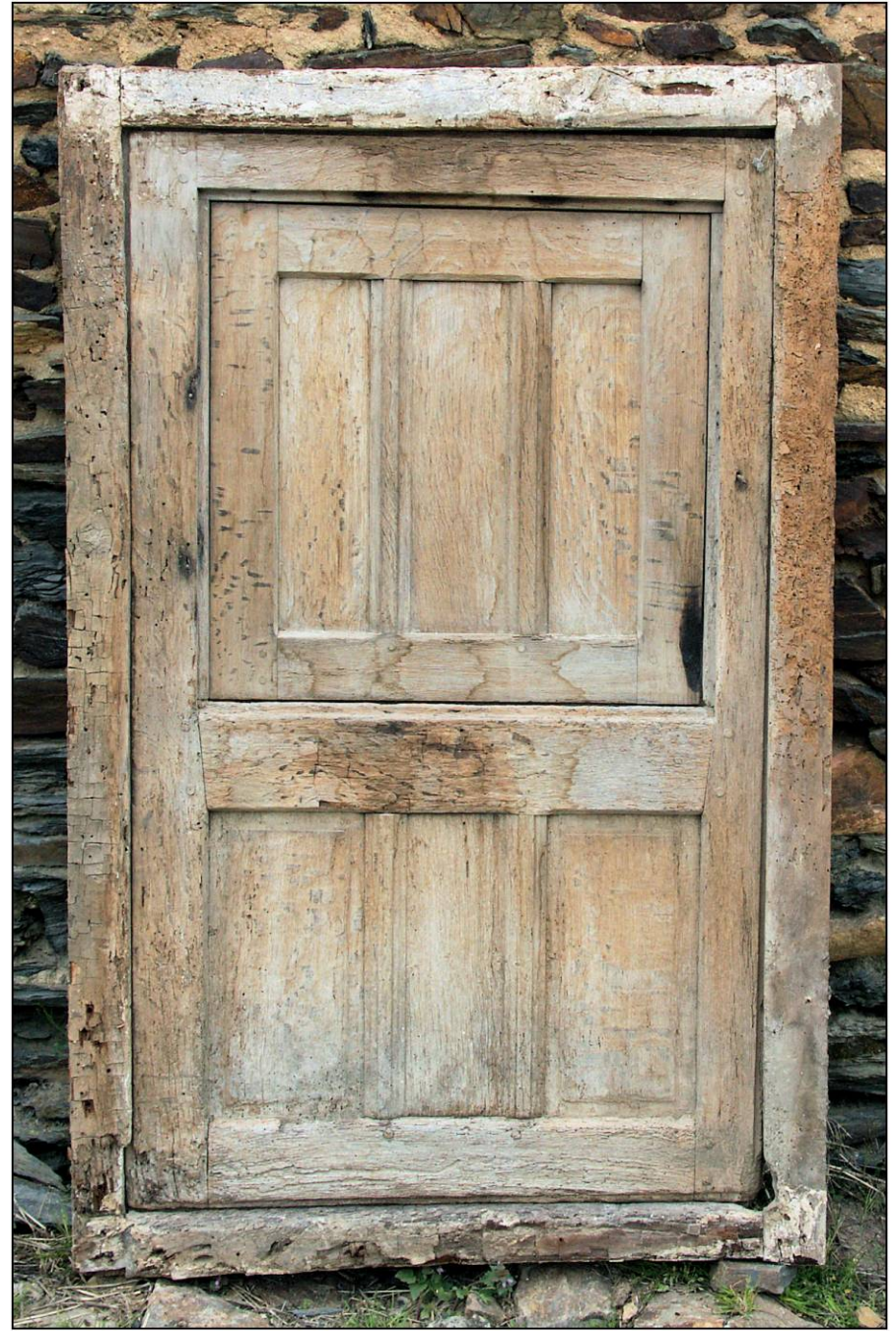
Fig. 4.2. Elévation extérieure