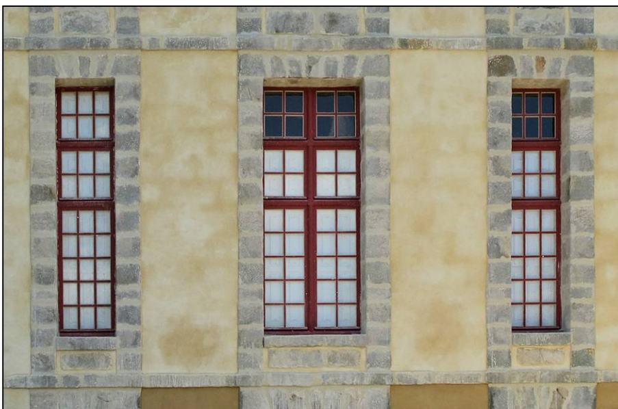
Fig. 2.5. Fenêtres (façade postérieure)