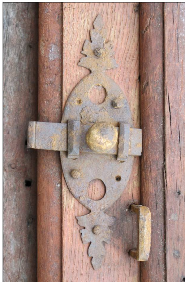
Fig. 2.3. Targette (vantail intermédiaire)