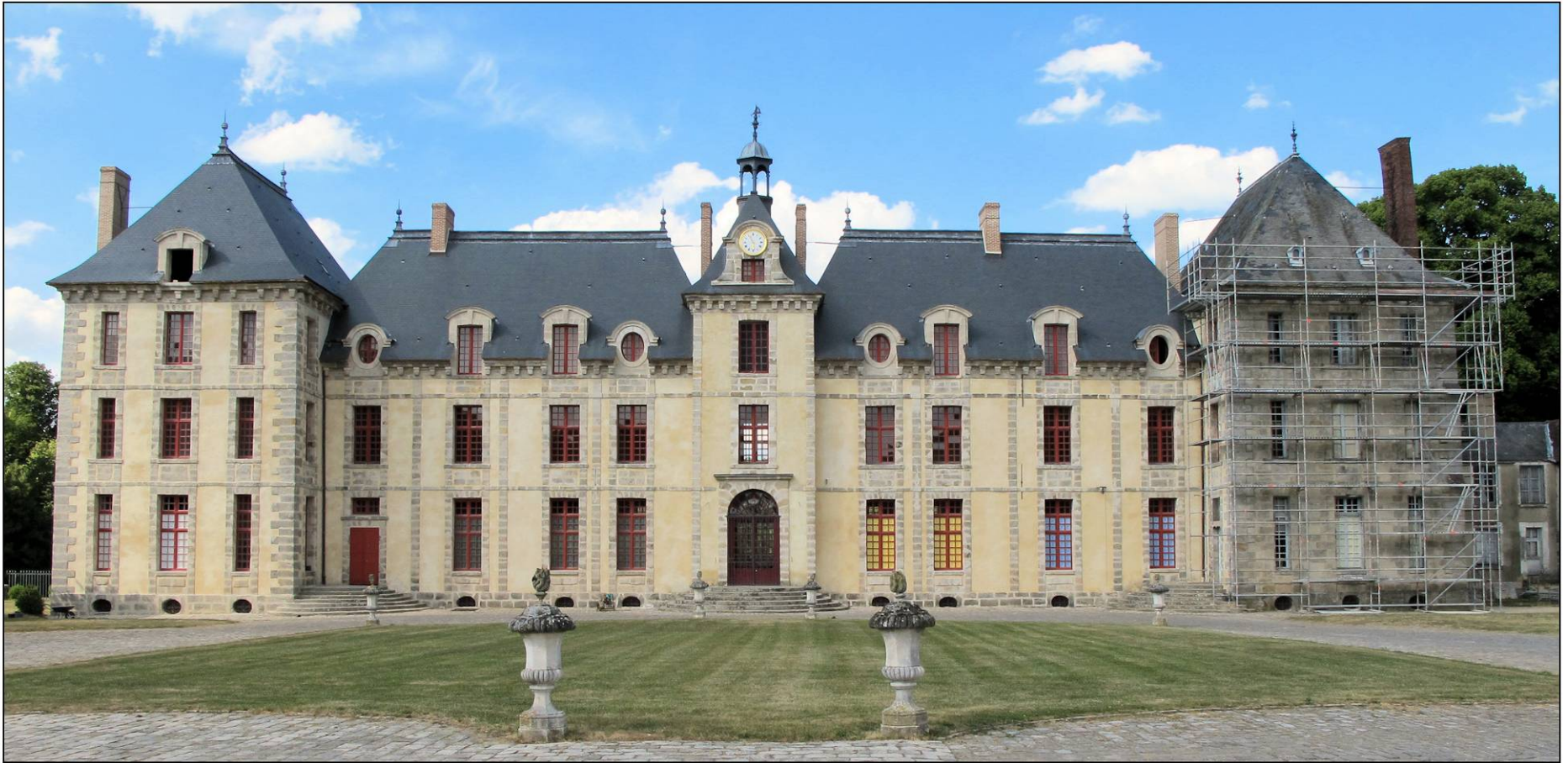
Fig. 2.1. Façade antérieure (sud)