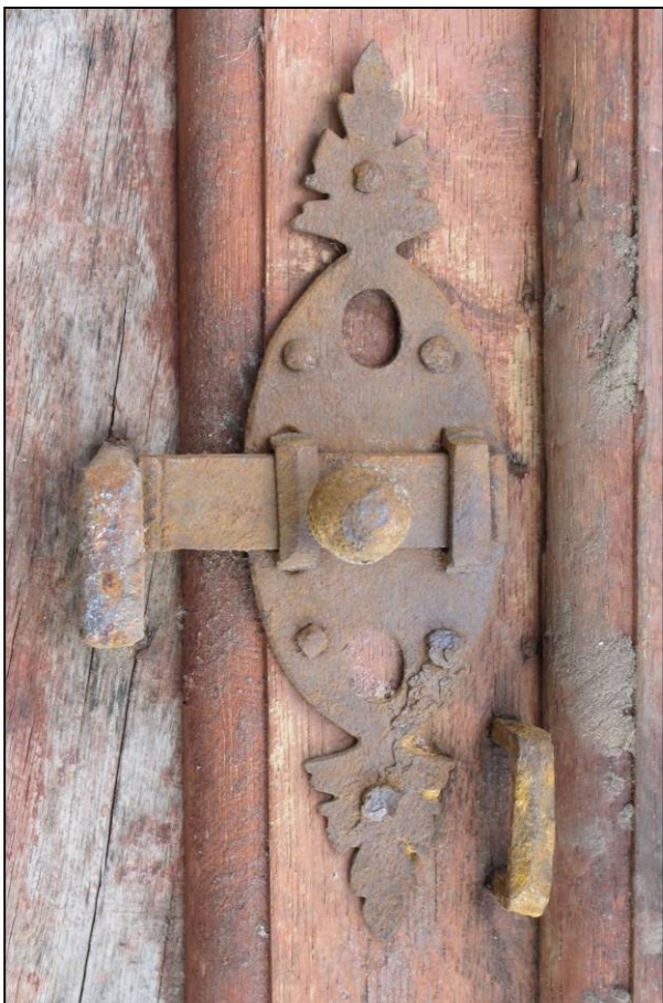
Fig. 2.2. Targette (vantail inférieur)