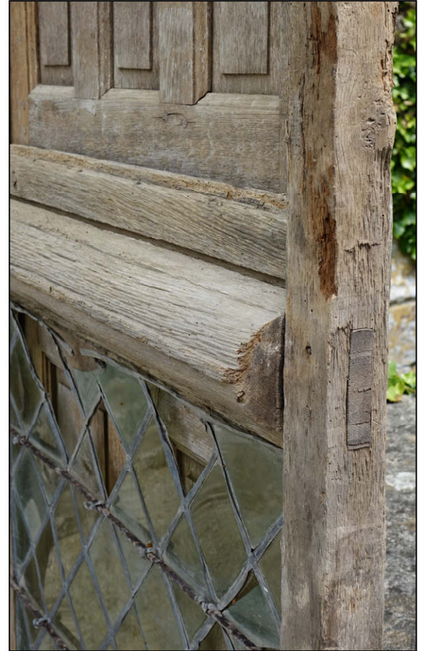
Fig. 2.3. Traverse moulurée