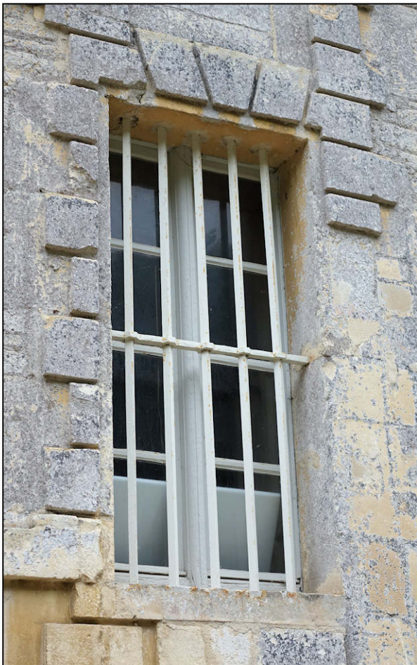
Fig. 2.4. Fenêtre à meneau mouluré