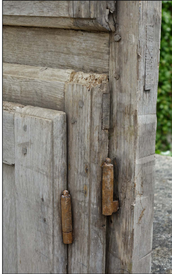
Fig. 2.2. Fiches à gond