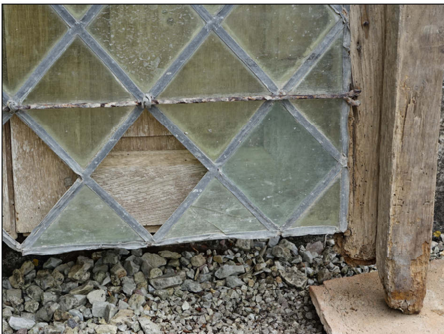
Fig. 2.6. Vitrierie inférieure