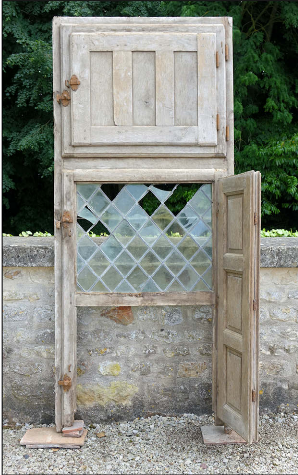
Fig. 2.1. Elévation intérieure