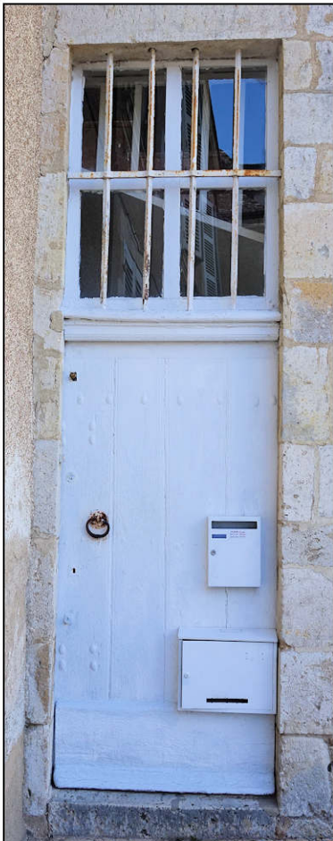
Fig. 10.3. Logis / façade est