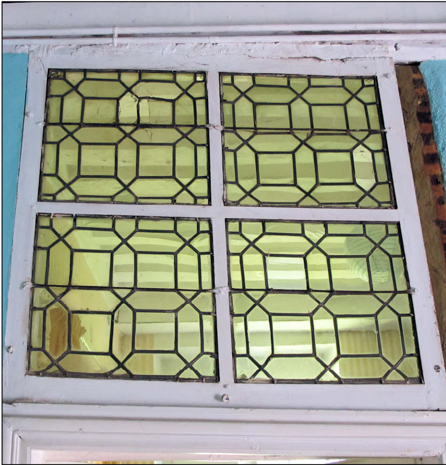
Fig. 10.1. Chapelle / vitrerie