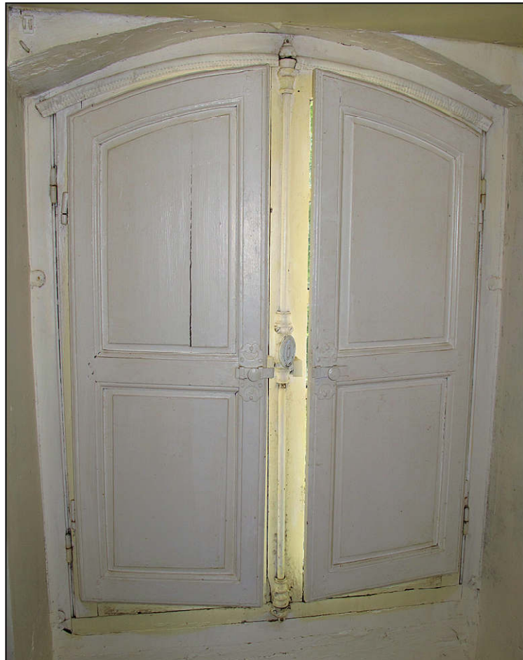
Fig. 10.4. Logis / lucarne