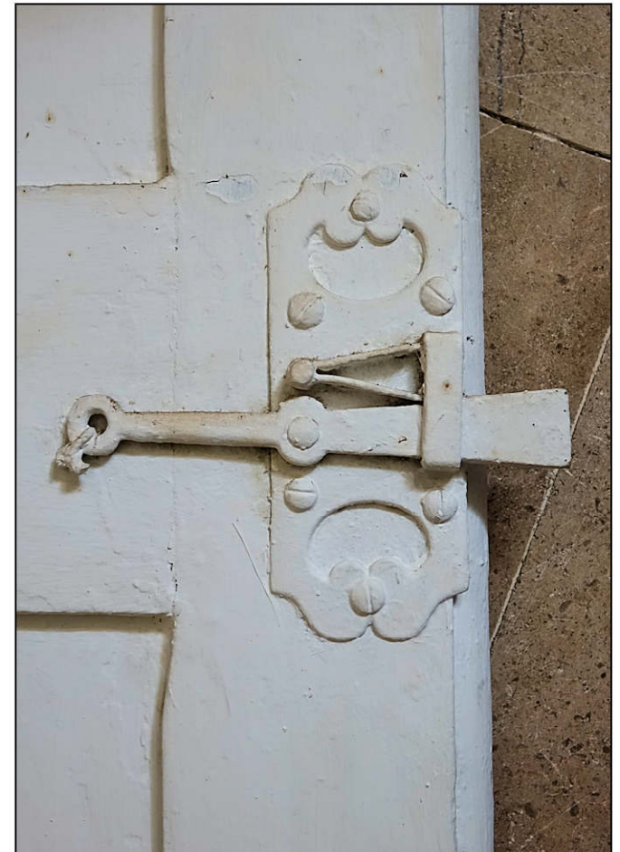
Fig. 10.5. Chapelle / loquet