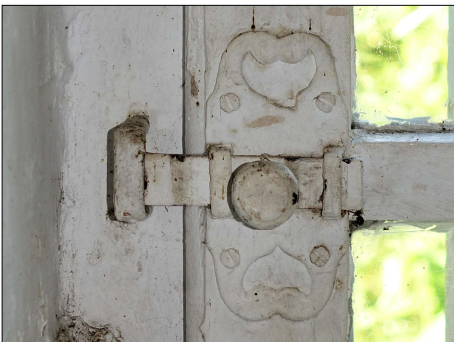
Fig. 10.6. Aile nord / targette