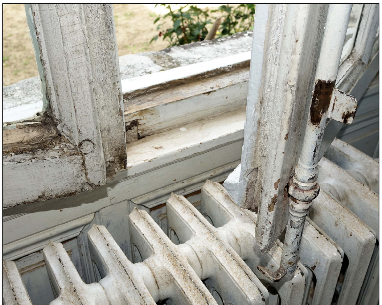
Fig. 9.5. Croisée (battants du milieu)