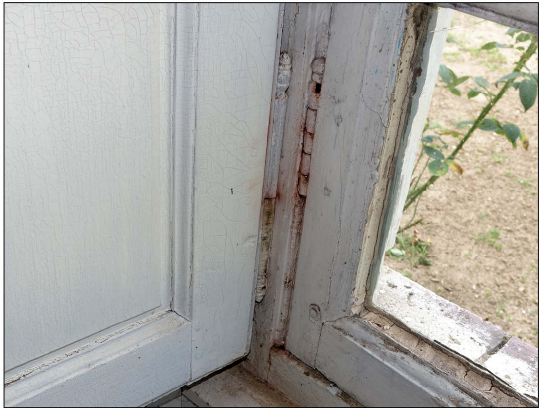
Fig. 9.3. Fiches