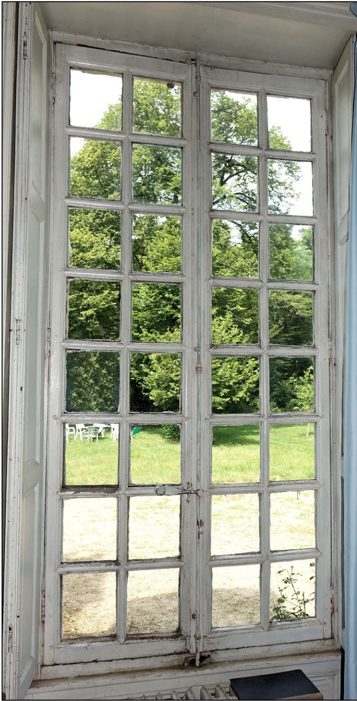
Fig. 9.1. Logis / façade ouest