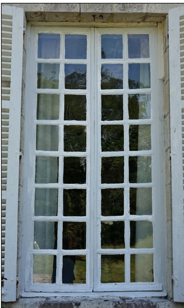
Fig. 9.4. Logis / façade ouest