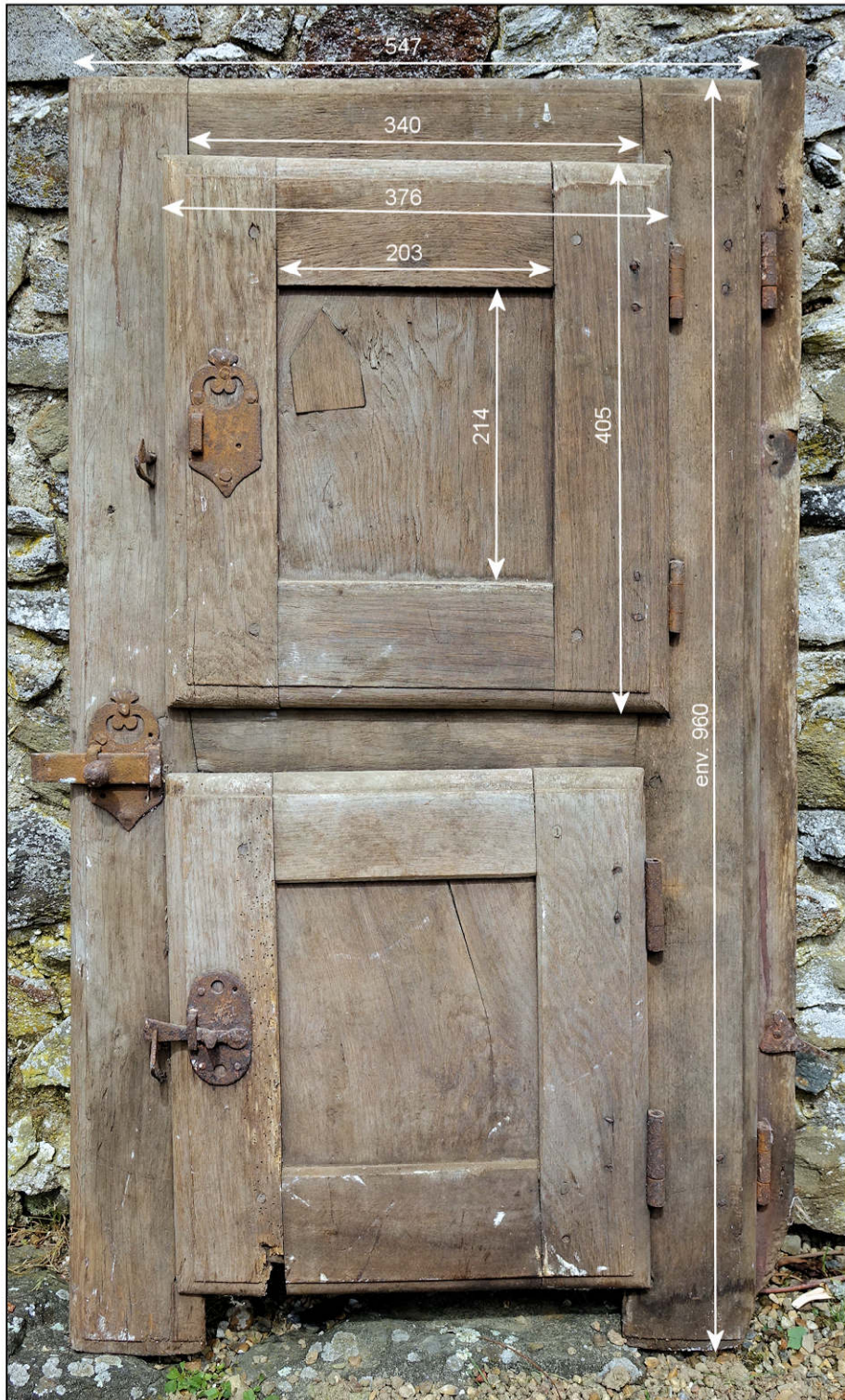
Fig. 6.1. Vue intérieure