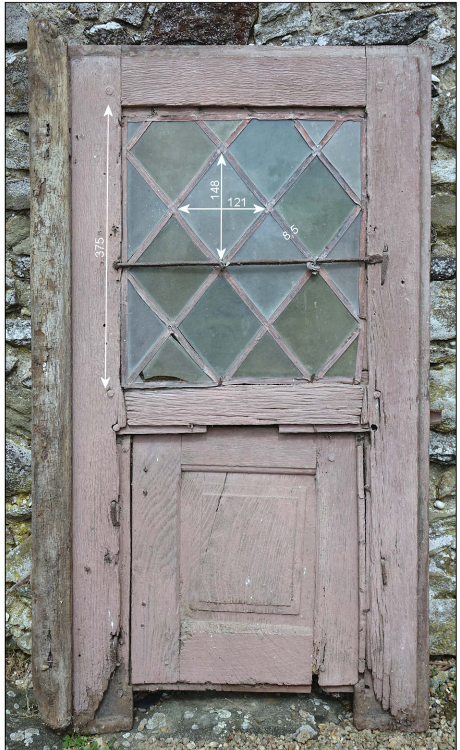
Fig. 6.2. Vue extérieure