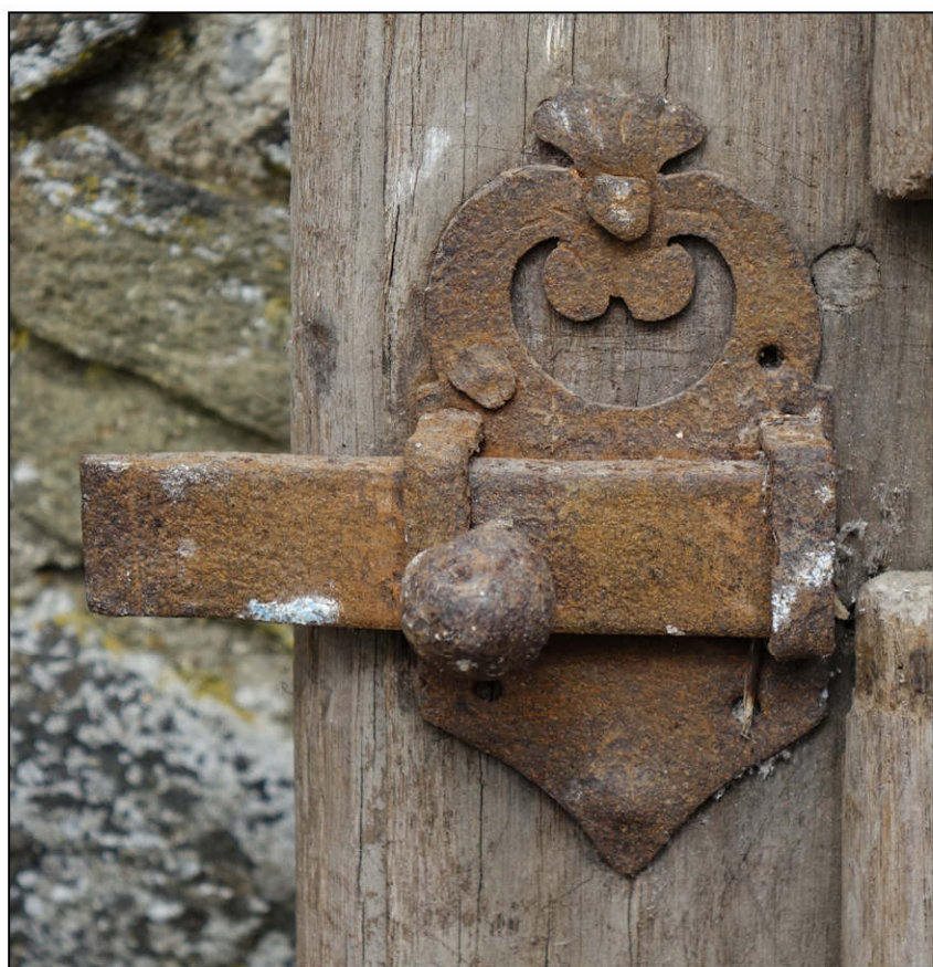
Fig. 6.3. Targette