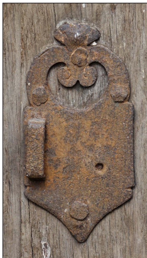
Fig. 6.4. Loquet