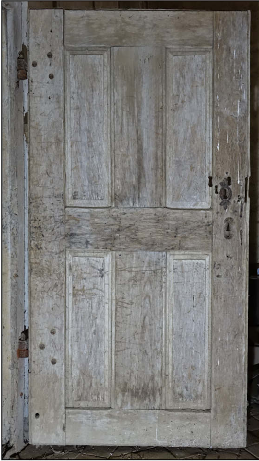
Fig. 4.1. Porte 2