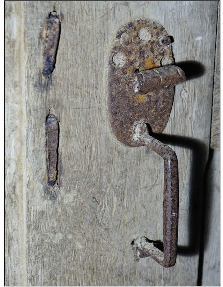
Fig. 4.3. Loquet à poucier (porte 2)