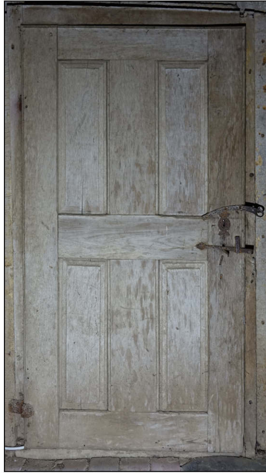
Fig. 4.2. Porte 2