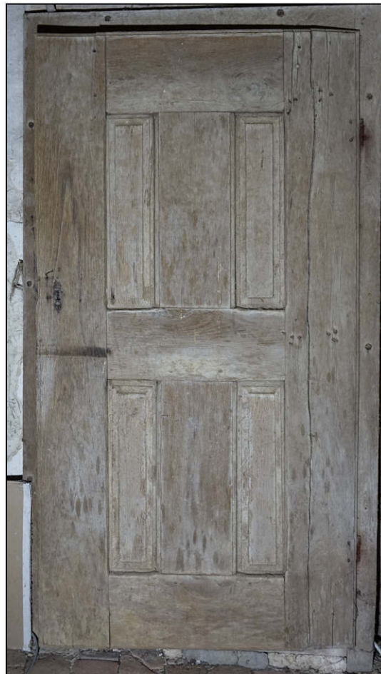
Fig. 4.5. Porte 3