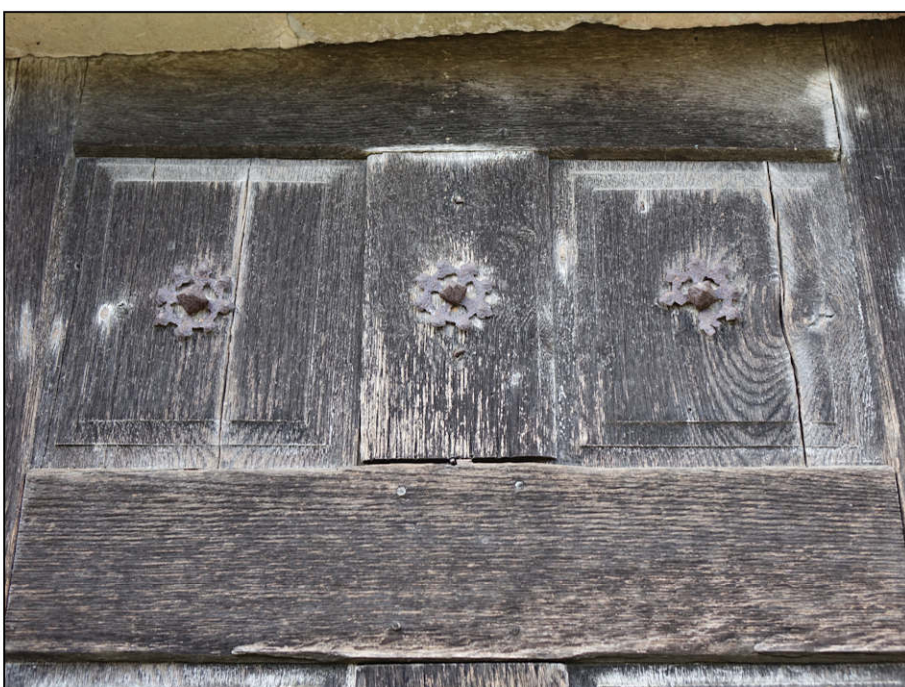
Fig. 4.7. Porte 1