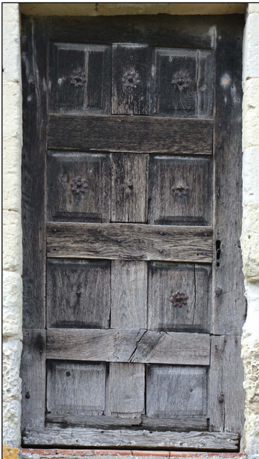
Fig. 4.4. Porte 1