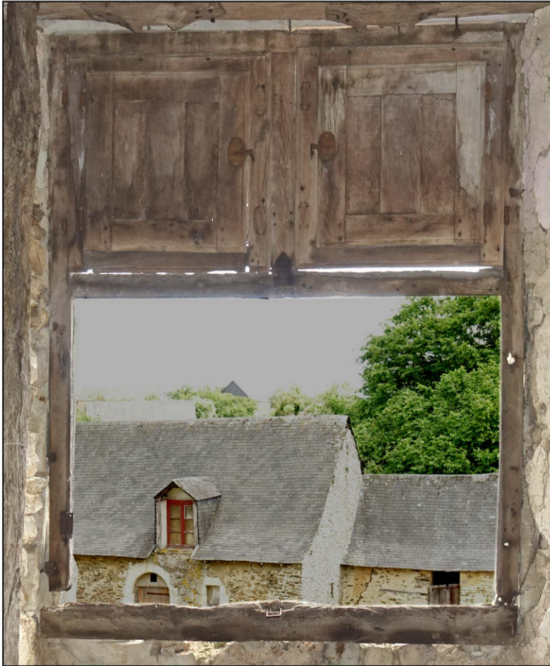
Fig. 3.1. Vue intérieure