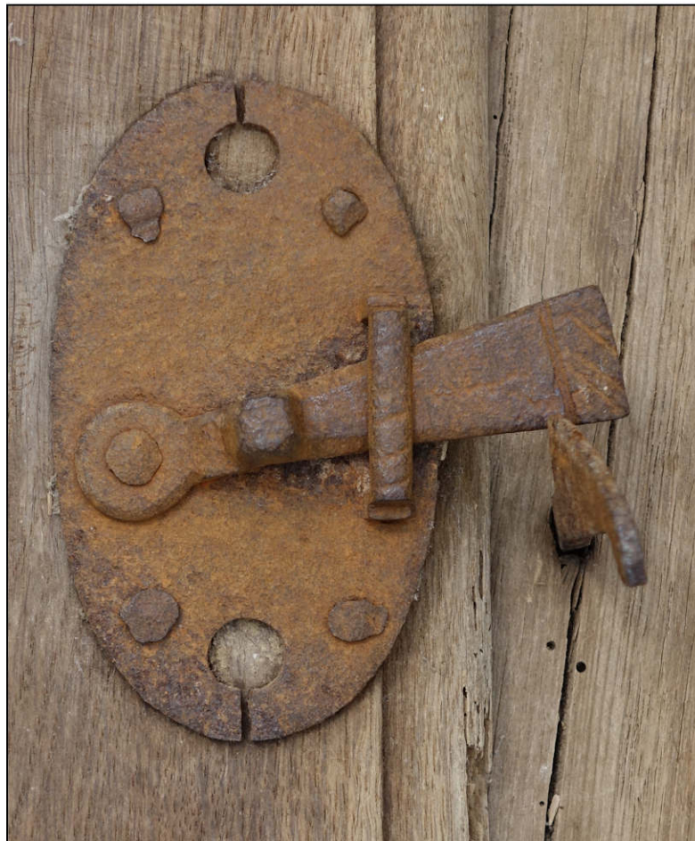
Fig. 3.4. Loquet