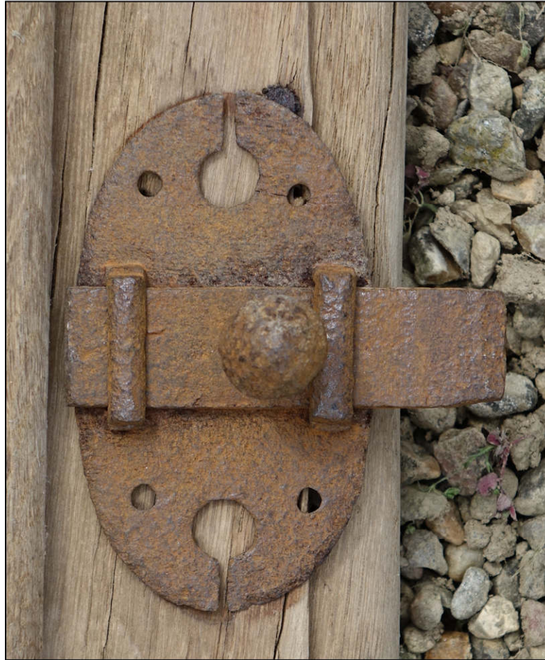
Fig. 3.2. Targette