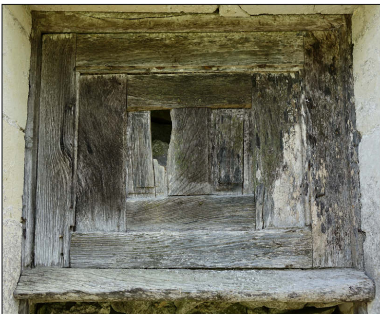
Fig. 3.5. Fenêtre 4