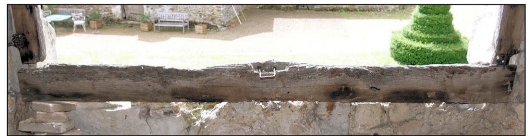
Fig. 3.6. Pièce d'appui