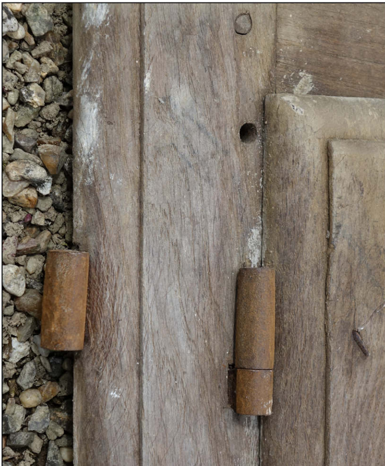
Fig. 3.3. Fiches à gond