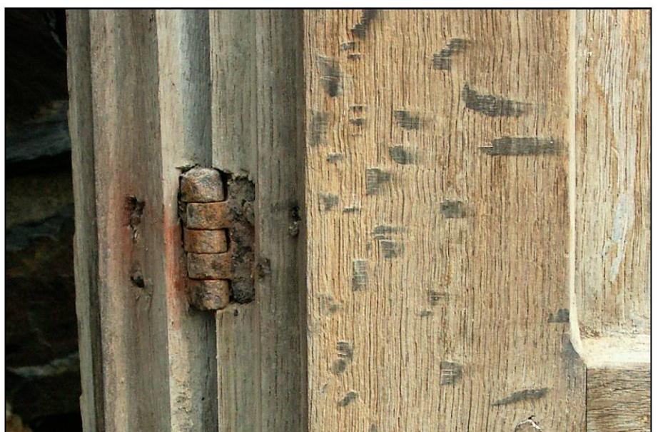
Fig. 2.6. Champigné (49) - Charnacé