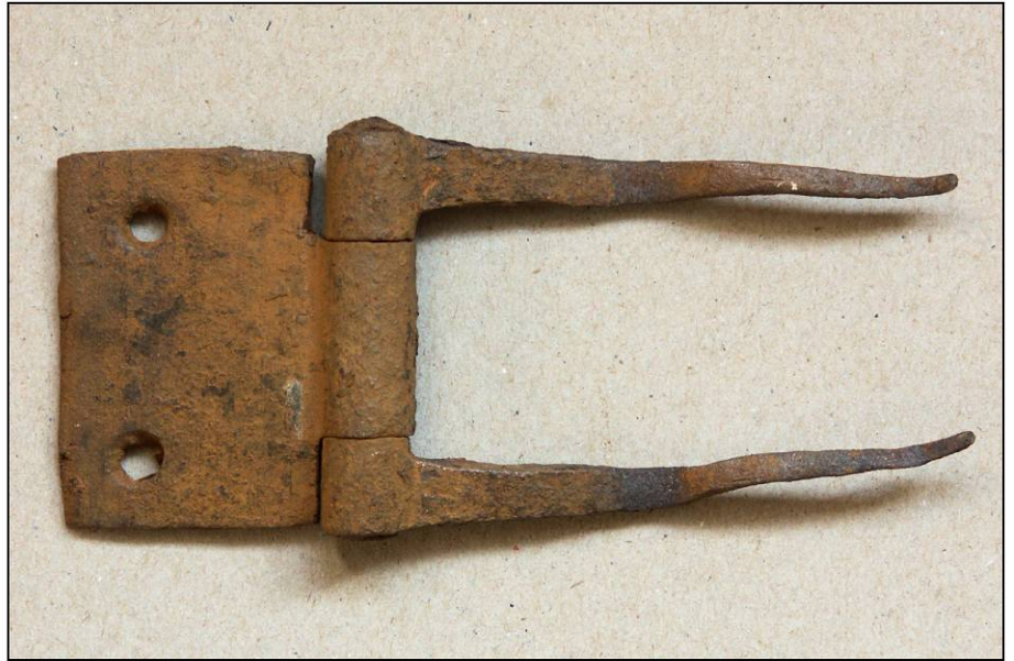
Fig. 2.2. Gourhel (56) - La Cour