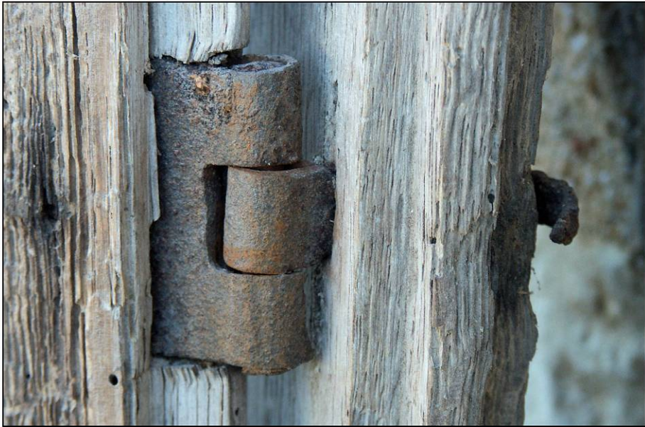
Fig. 2.1. Préaux-du-Perche (61) - La Petite Viandrie