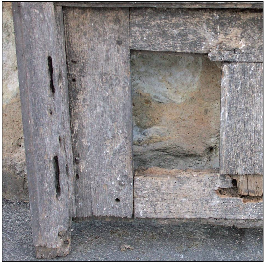
Fig. 2.4. Belfonds (61) - Cléray