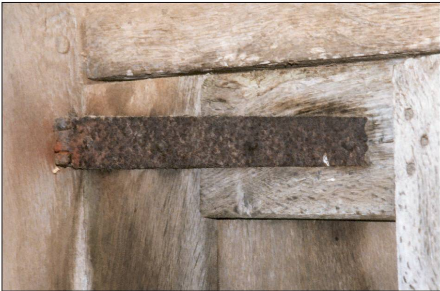
Fig. 2.3. Bignan (56) - Tréhardet