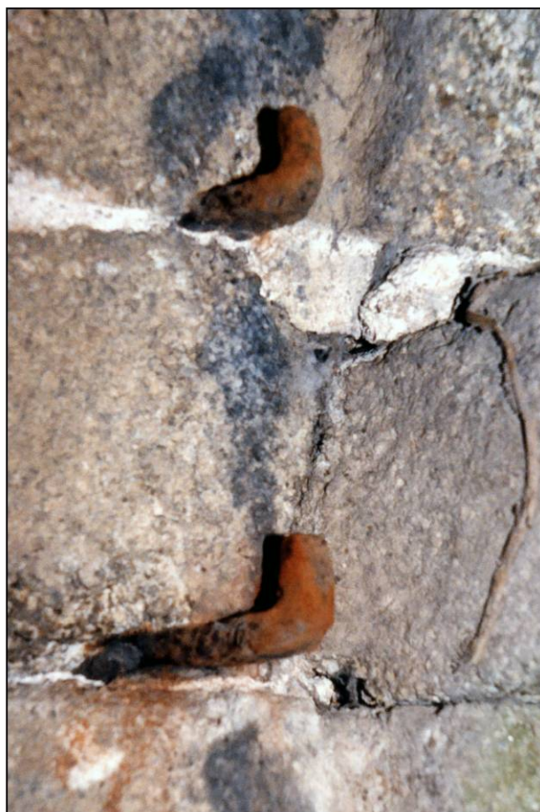
Fig. 1.5. Gonds (ébrasement gauche / croisillon)