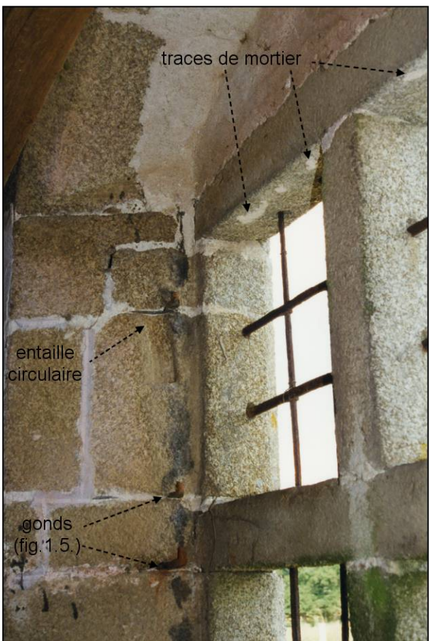
Fig. 1.4. Compartiment supérieur gauche