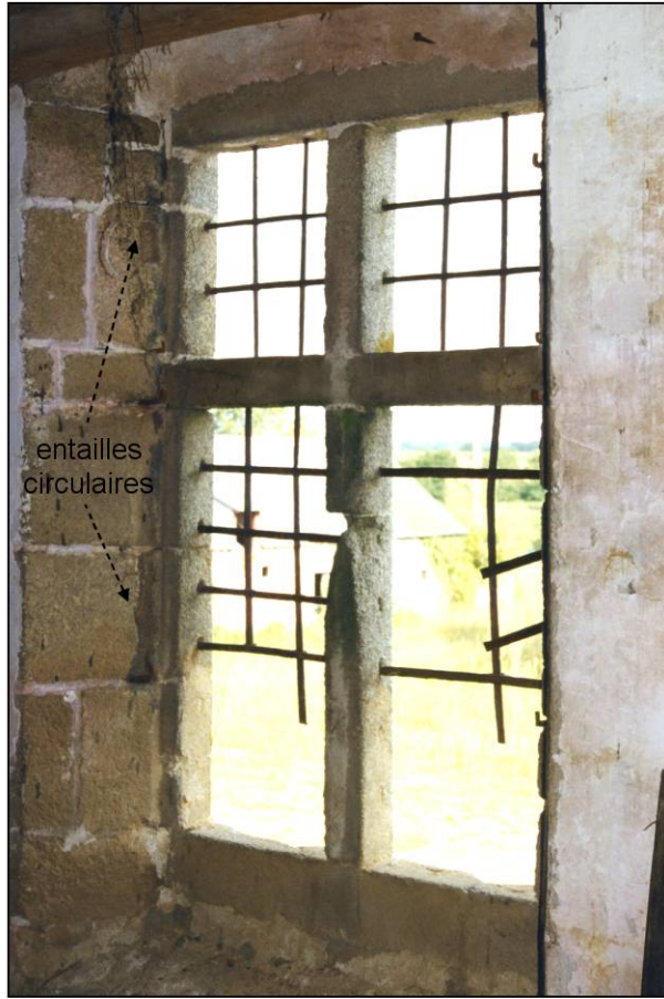
Fig. 1.2. Fenêtre (int. / ébrasement gauche)