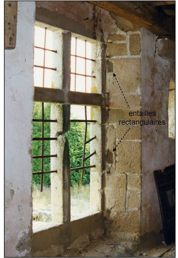
Fig. 1.3. Fenêtre (int. / ébrasement droit)