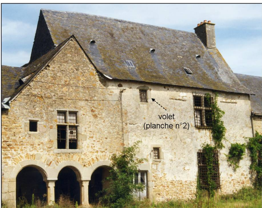
Fig. 1.7. Edifice (façade antérieure) A gauche, l'auditoire de justice A droite, le logis seigneurial