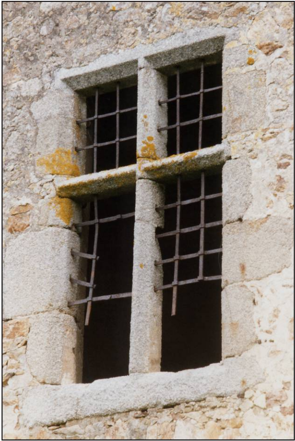
Fig. 1.1. Fenêtre