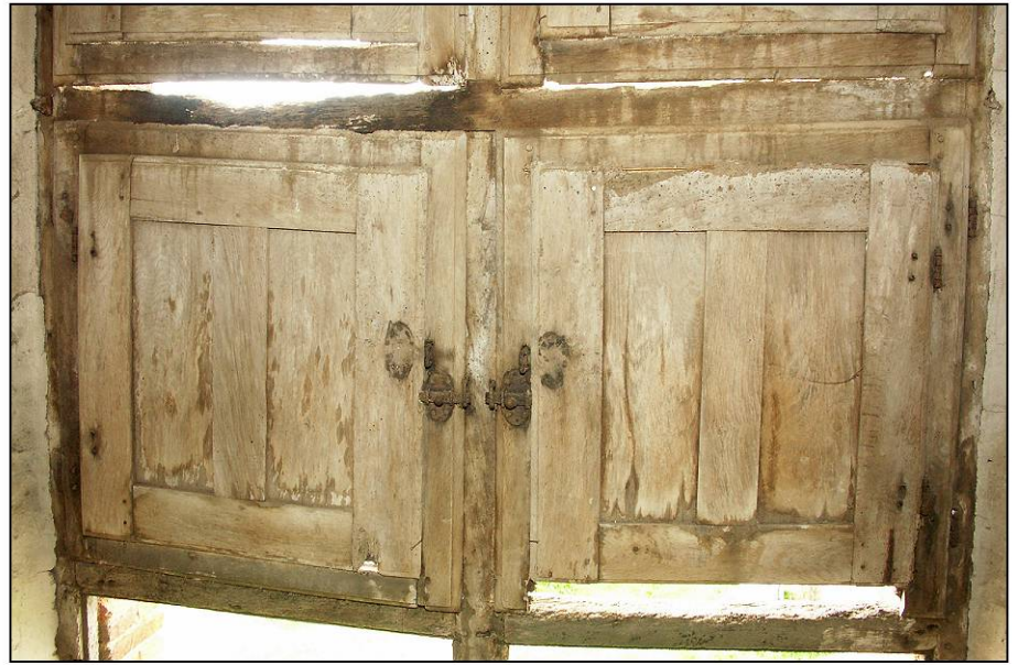
Fig. 3.2. Compartiments intermédiaires