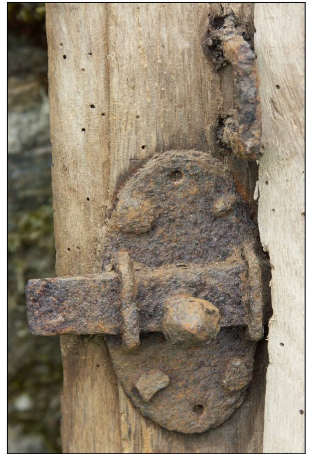
Fig. 3.4. Targette