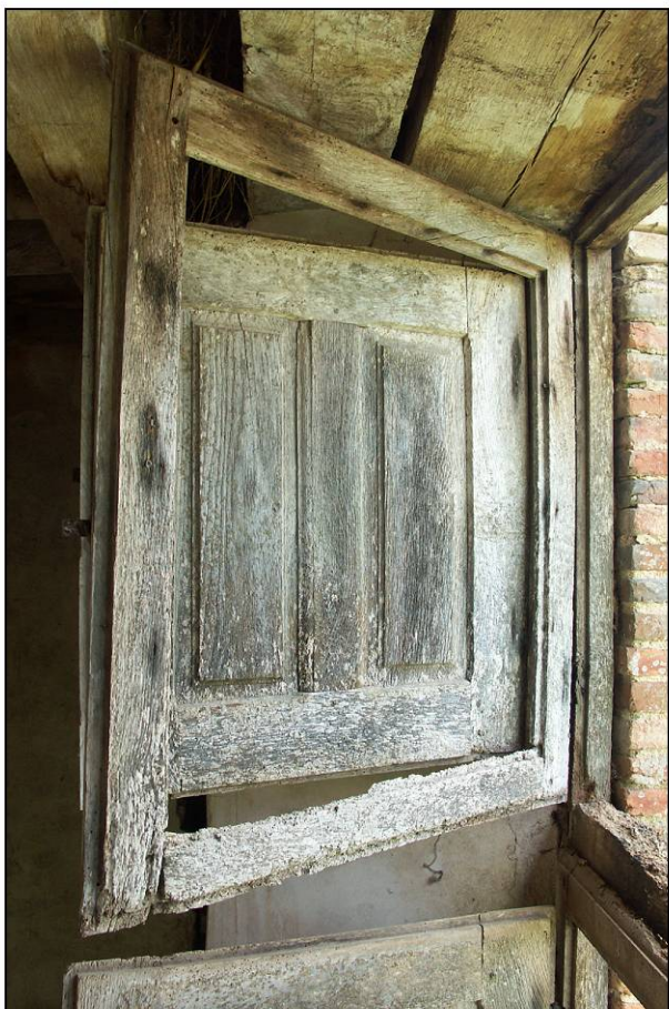
Fig. 3.5. Compartiment supérieur gauche