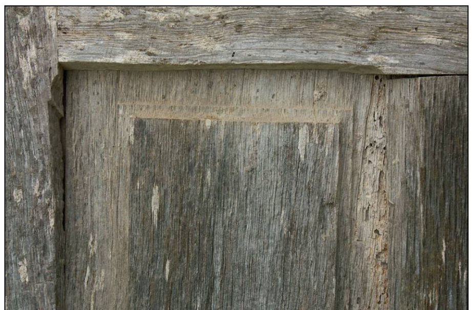
Fig. 3.6. Volet / parement extérieur (détail mouluration)