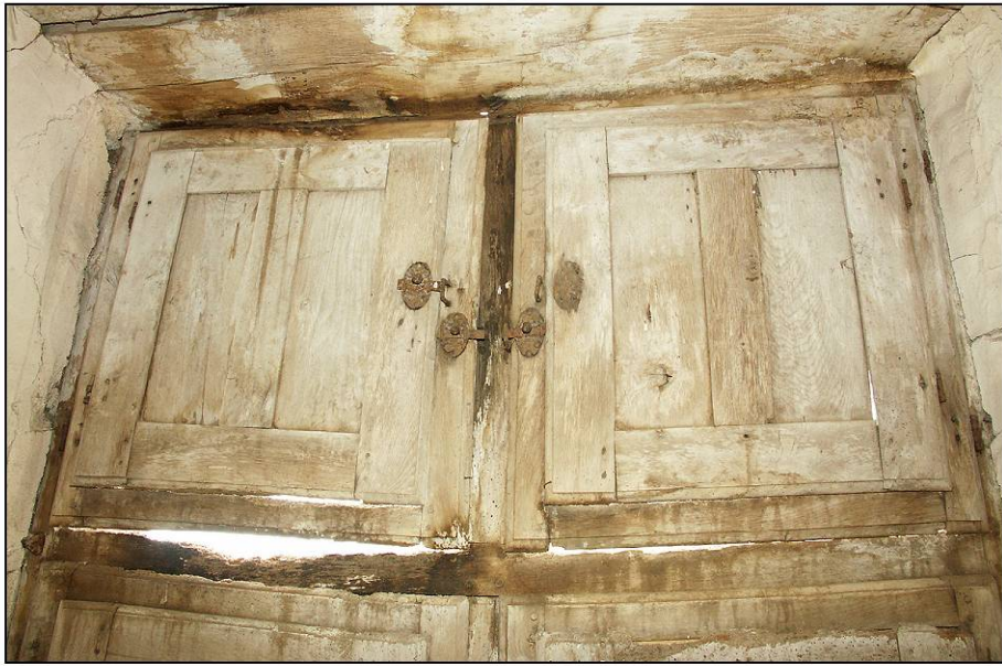
Fig. 3.1. Compartiments supérieurs