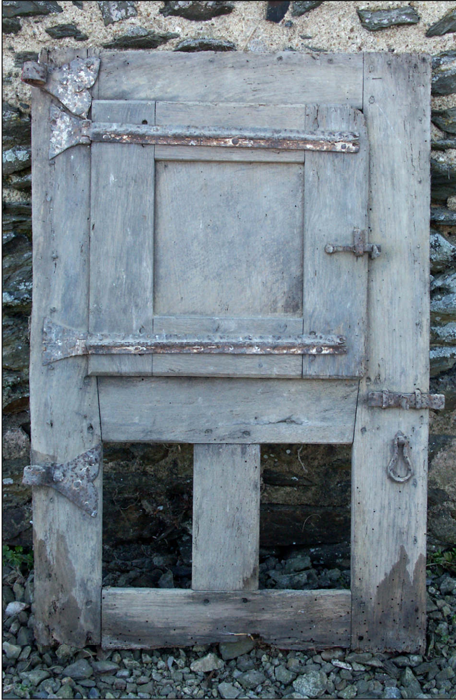
Fig. 6.1. Elévation intérieure