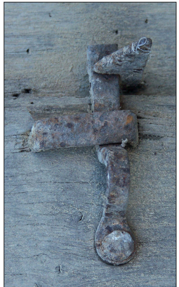
Fig. 6.5. Loquet