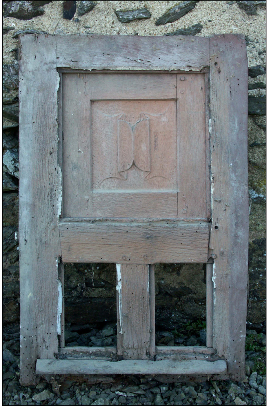
Fig. 6.2. Elévation extérieure