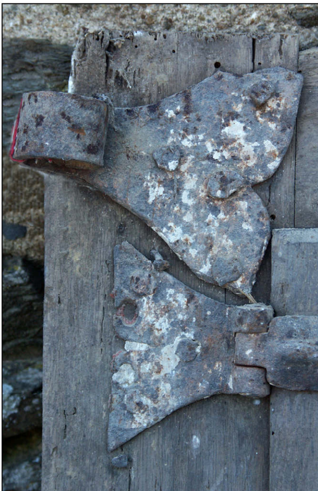
Fig. 6.3. Paumelle