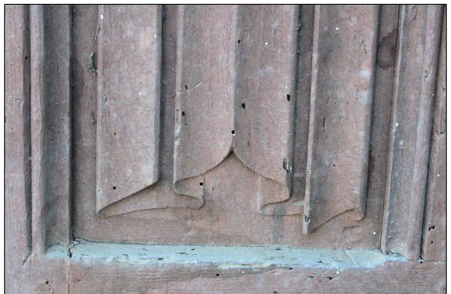
Fig. 3.6. Volet / panneau à plis de serviette