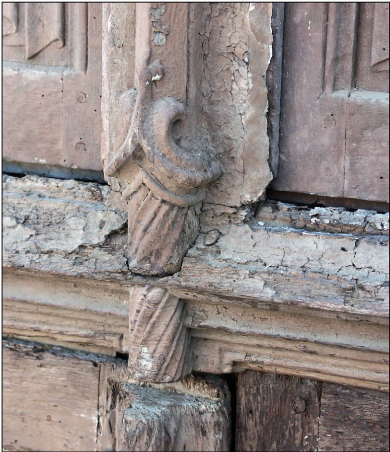
Fig. 3.3. Croisillon / meneau