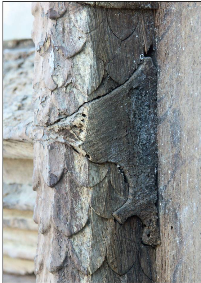
Fig. 3.4. Bati dormant / traverse inter. (croisillon)