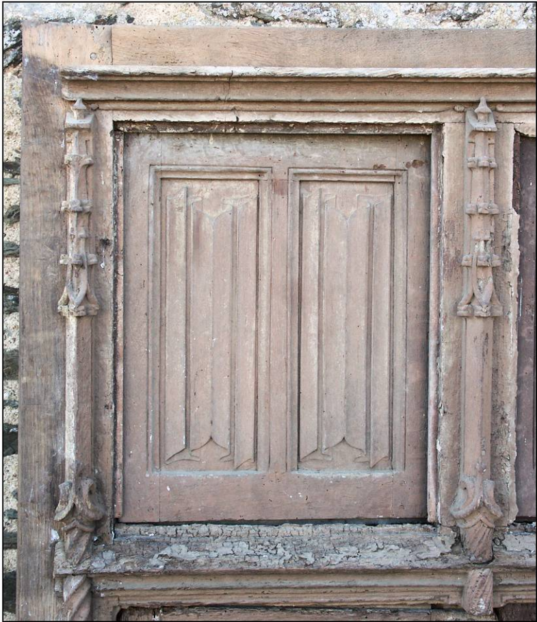
Fig. 3.1. Compartiment supérieur droit