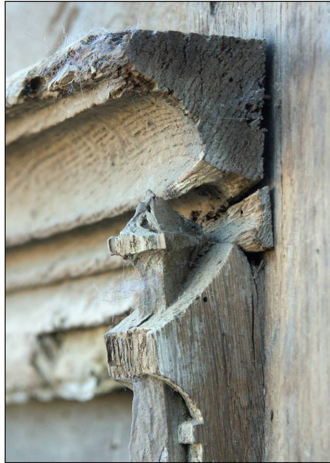
Fig. 3.2. Bati dormant / traverse haute