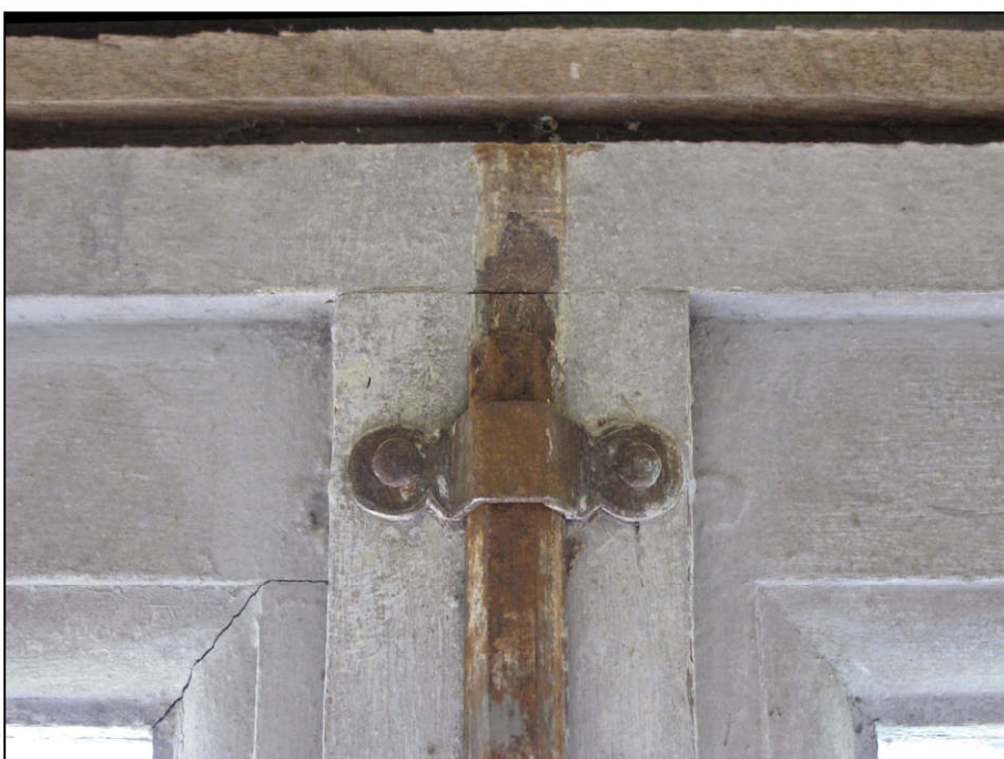
Fig. 11.8. Crémone / tringle et conduit