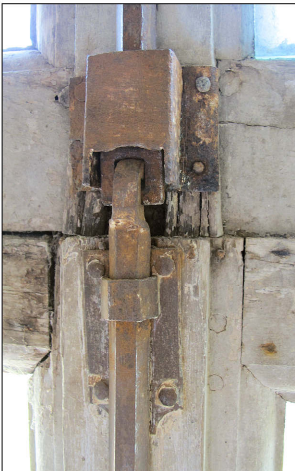
Fig. 11.5. Verrou supérieur