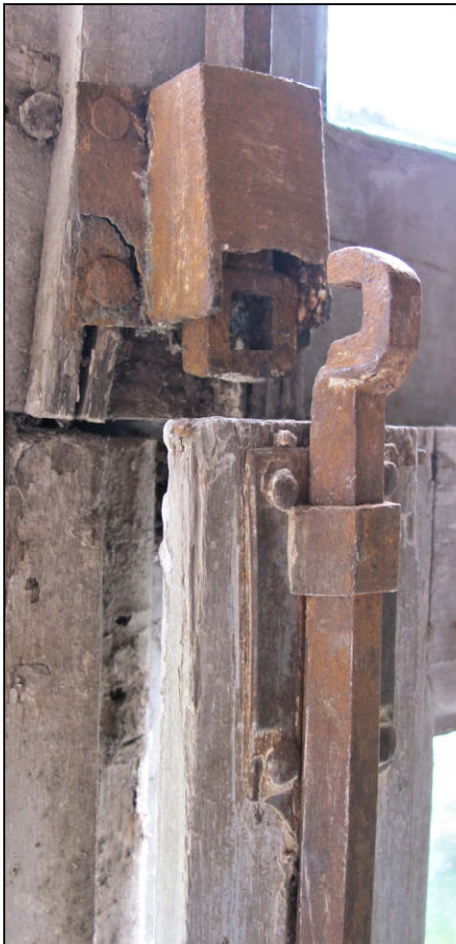
Fig. 11.1. Verrou supérieur