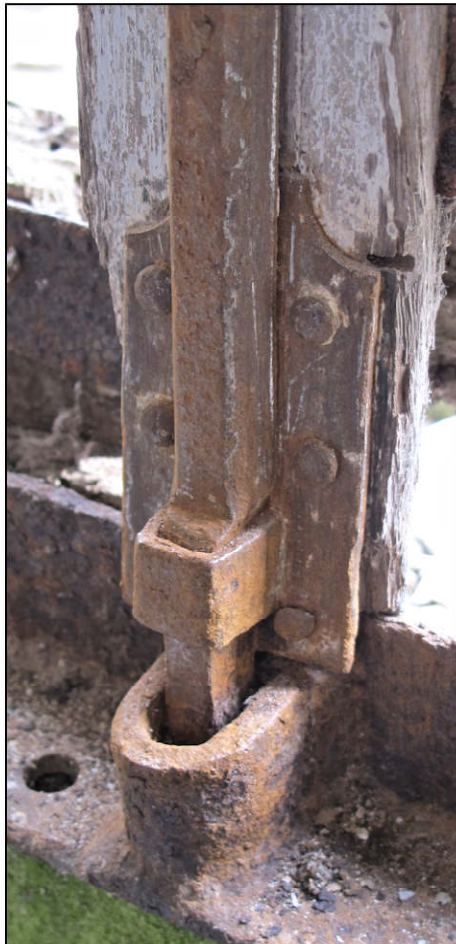
Fig. 11.2. Verrou inférieur