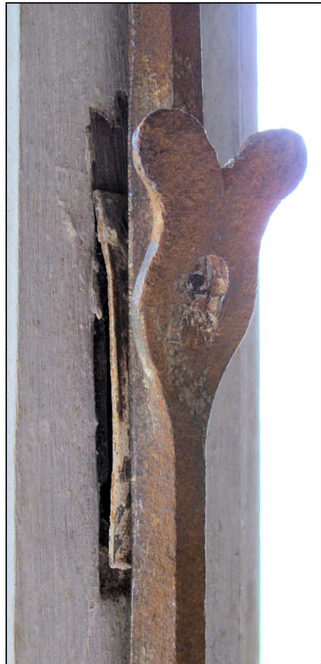
Fig. 11.3. Fermeture des volets