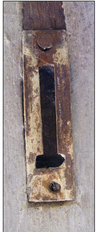
Fig. 11.4. Ressort de tringle