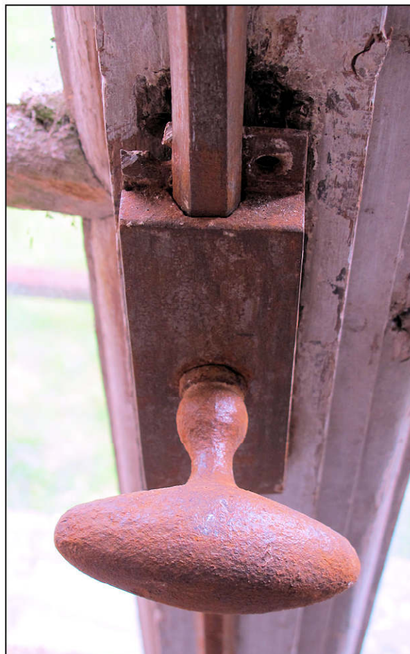
Fig. 11.6. Crémone / boîte et poignée