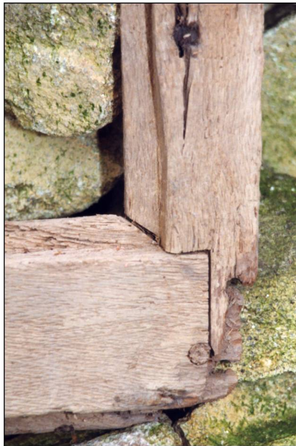
Fig. 2.5. Dormant B - Montant d. / croisillon (int.)