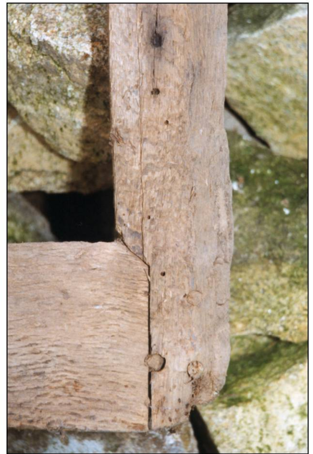
Fig. 2.6. Dormant B - Montant g. / croisillon (ext.)