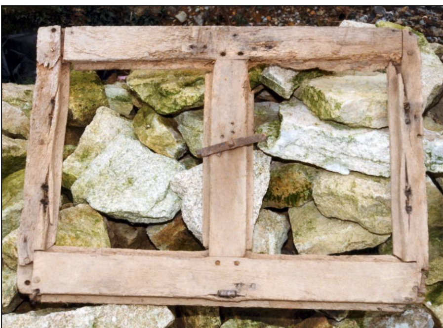
Fig. 2.7. Dormant B (élévation intérieure)