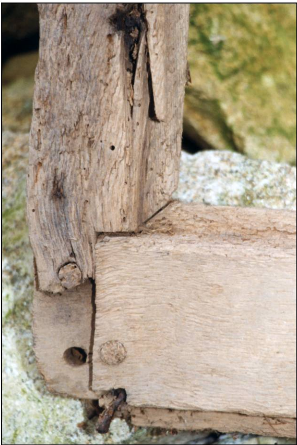
Fig. 2.4. Dormant B - Montant g. / croisillon (int.)