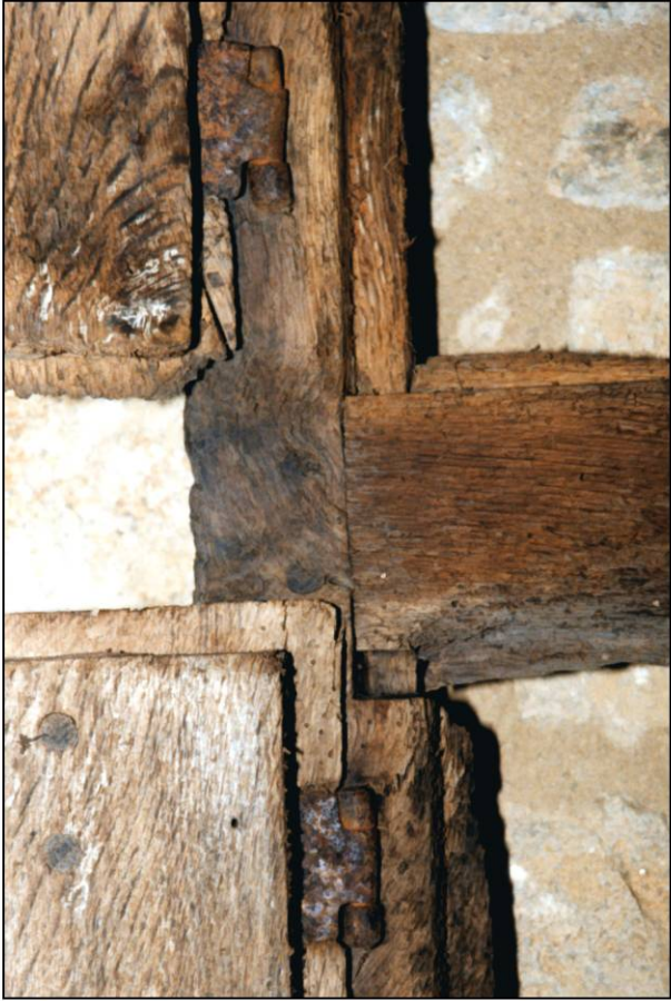
Fig. 2.1. Dormant A - montant g. / croisillon (int.)