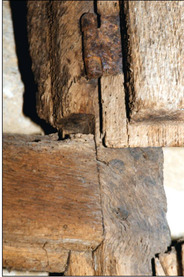
Fig. 2.2. Dormant A - montant d. / croisillon (int.)