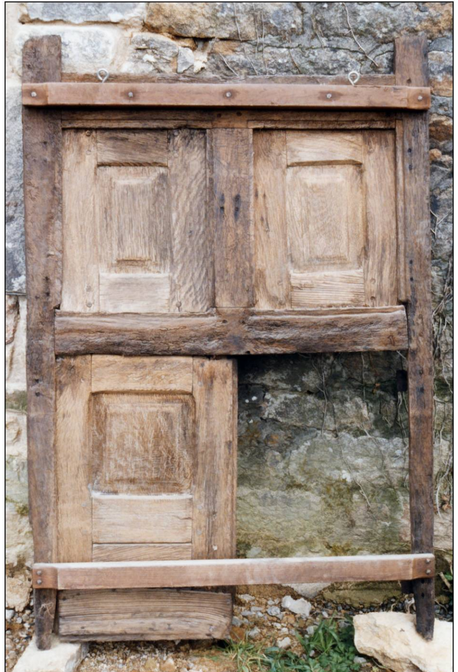
Fig. 1.2. Croisée (élévation extérieure)