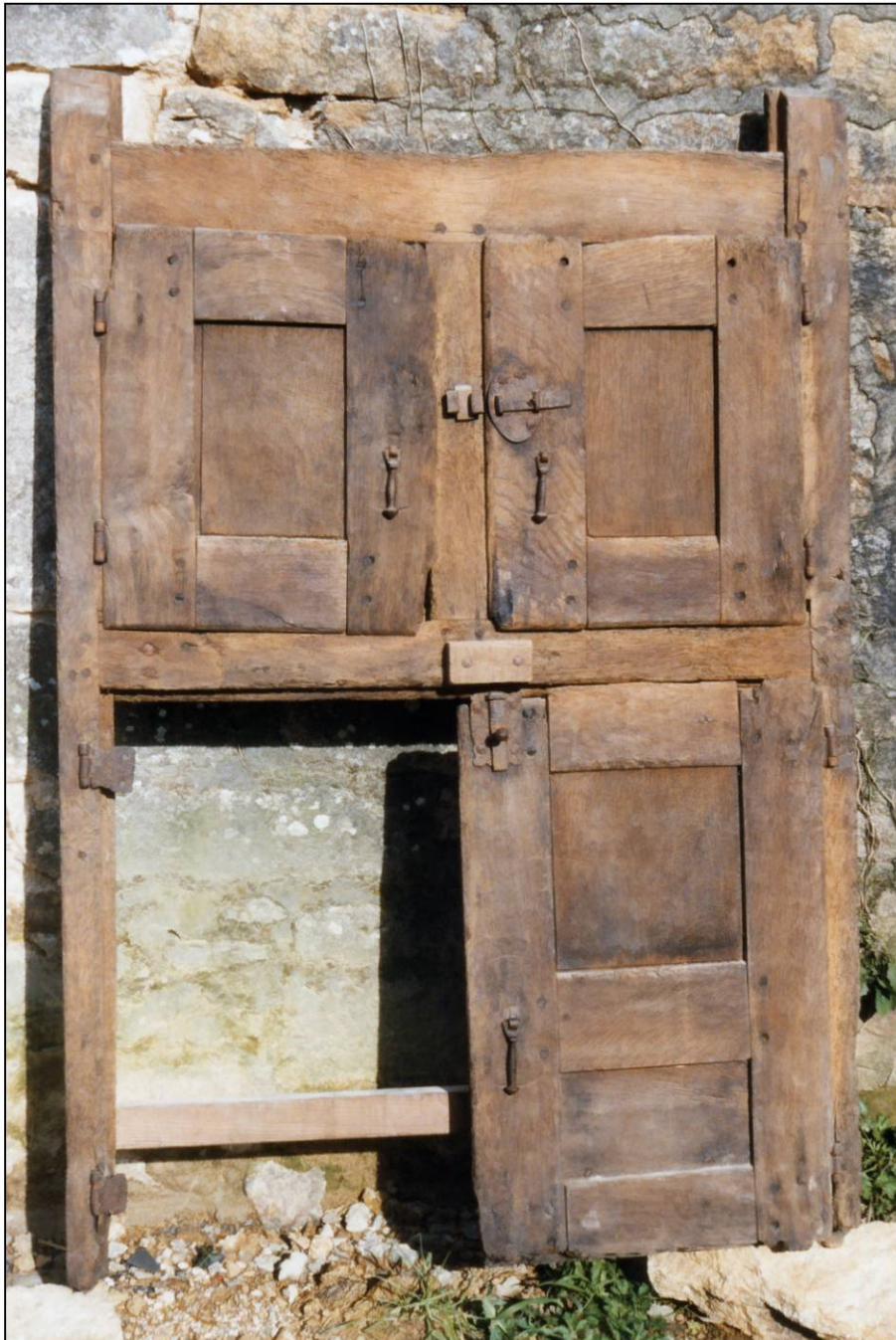
Fig. 1.1. Croisée (élévation intérieure)