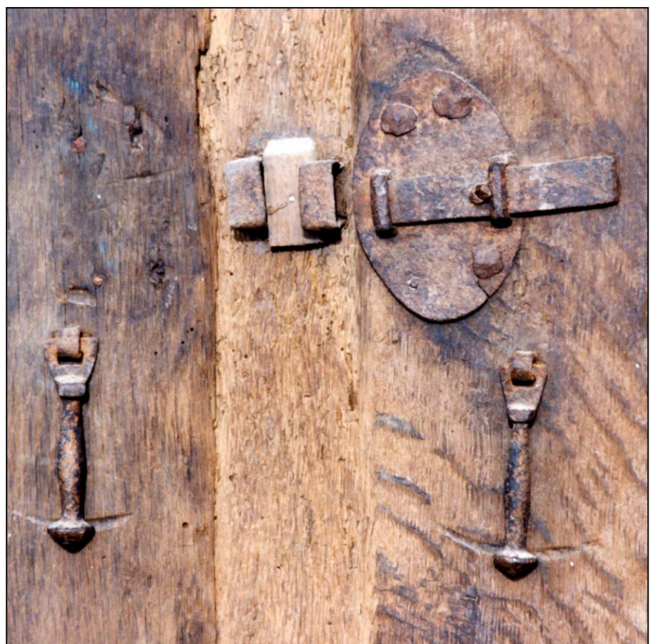
Fig. 1.4. Targette et pendeloques