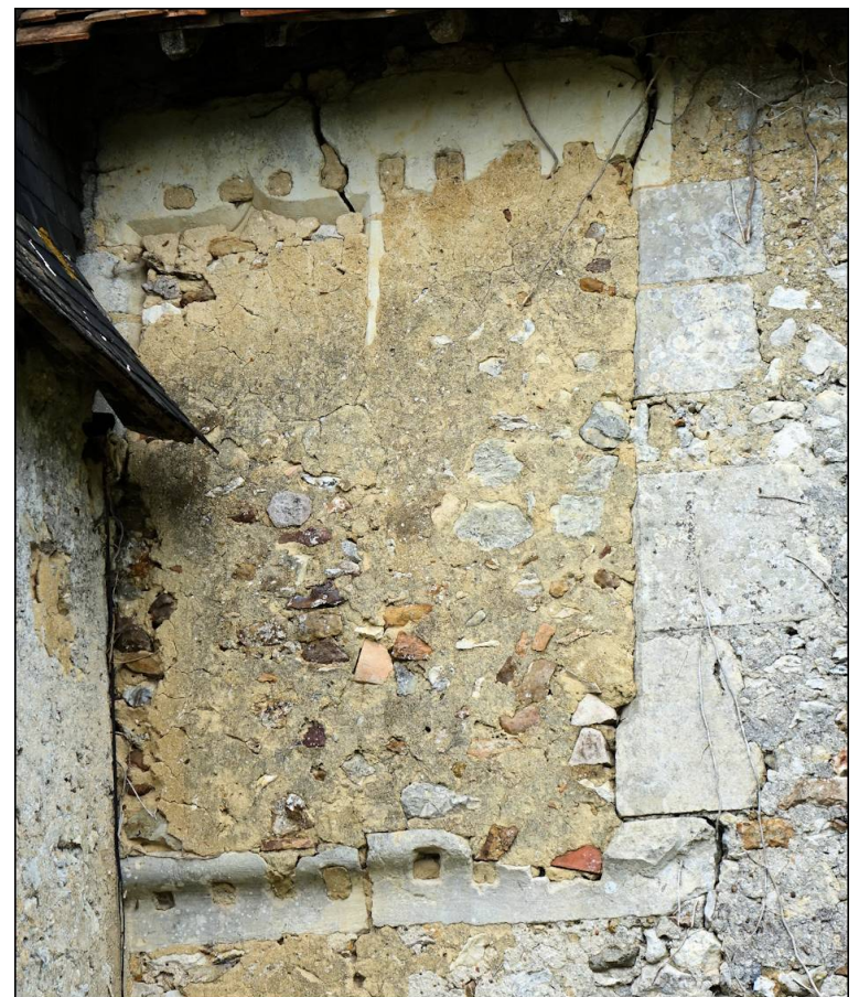
Fig. E.1 – Croisée murée et masquée en partie par l'escalier hors-oeuvre ajouté postérieurement.

Ce petit logis est composé de deux pièces basses au rez-de-chaussée et de deux pièces à l'étage, chacune étant chauffée par une cheminée. Sa distribution initiale a été modifiée, notamment par l'ajout d'un escalier hors-œuvre. Si son rez-de-chaussée a été fortement perturbé, son étage conserve quant à lui une authenticité certaine et plus particulièrement une grande croisée murée (figure E.1 ci-contre) et deux demi-croisées, ces dernières éclairant sur une même façade les deux pièces séparées par une cloison en pan de bois. Ces trois fenêtres étaient protégées par des grilles aujourd'hui disparues. Les deux demi-croisées présentent la particularité de montrer deux conceptions différentes. La première (type A – planches n°1 et 2), qui a conservé les châssis de ses deux compartiments, était dotée en partie haute d'une vitrerie mise en plomb et en partie basse d'une toile cirée, ces deux matériaux translucides étant fixés sur des vantaux mobiles. La seconde (type B – planches n°3 et 4) n'a conservé que son volet du haut. Il témoigne cependant d'une conception bien différente puisque ce volet fermait un compartiment dont la vitrerie mise en plomb était scellée dans les tableaux de la fenêtre. Le compartiment du bas était alors probablement fermé par un simple volet 1 .