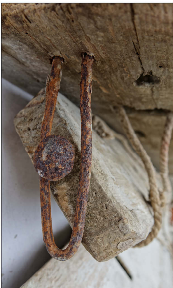
Fig. 6.5. Agrafe et tourillon (côté gauche)