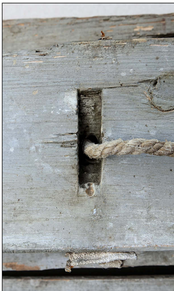
Fig. 6.6. Lumière de la lame mouvante