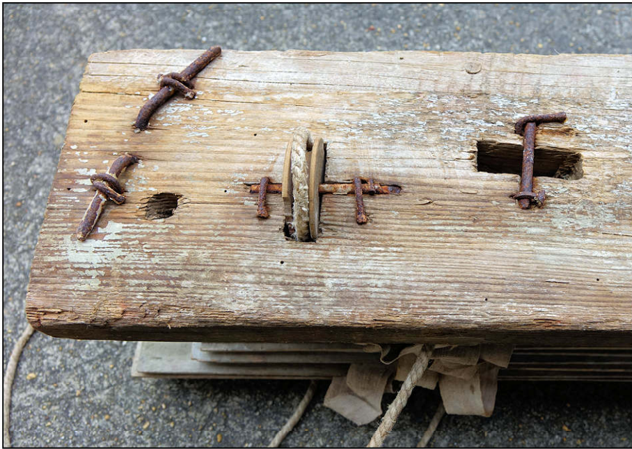
Fig. 6.1. Sommier