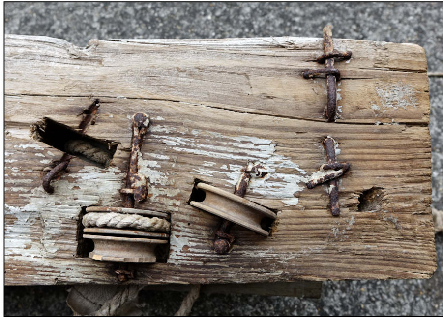
Fig. 6.2. Sommier