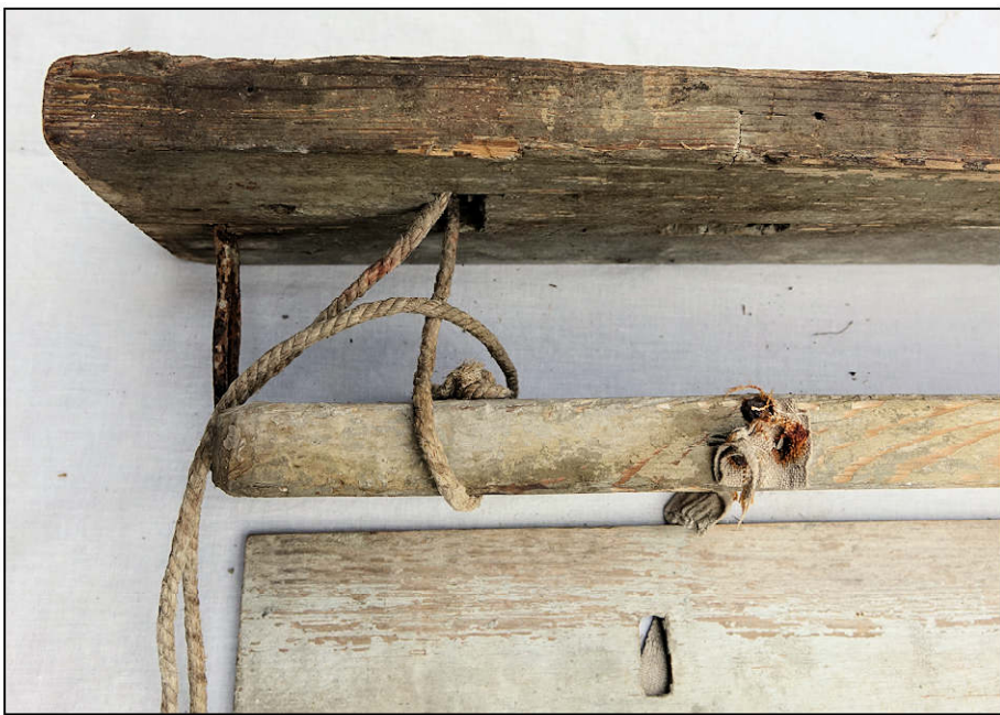
Fig. 6.3. Cordon d'inclinaison