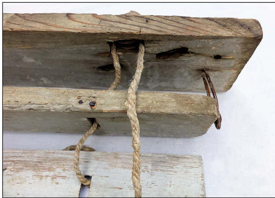
Fig. 6.4. Cordon de levage