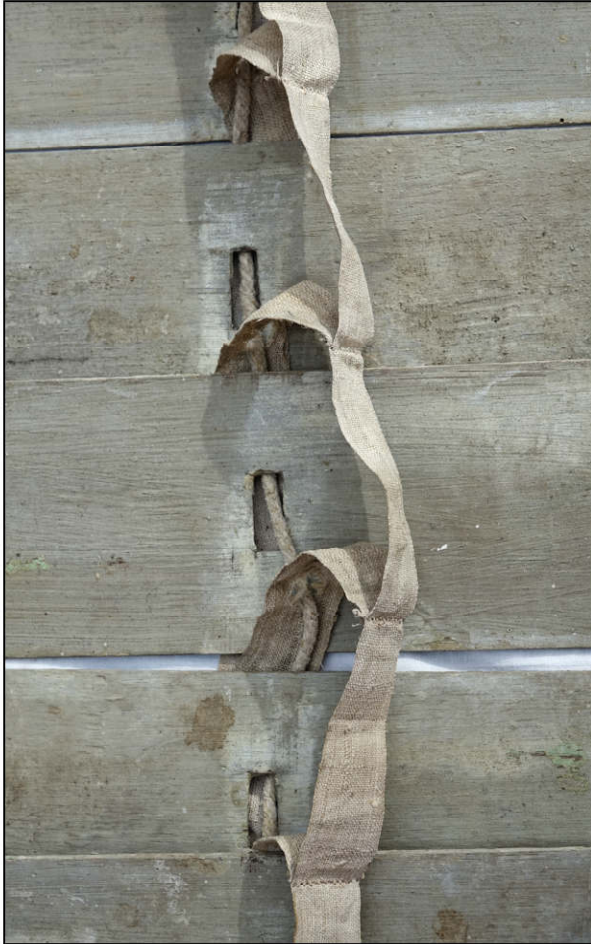
Fig. 4.1. Ruban