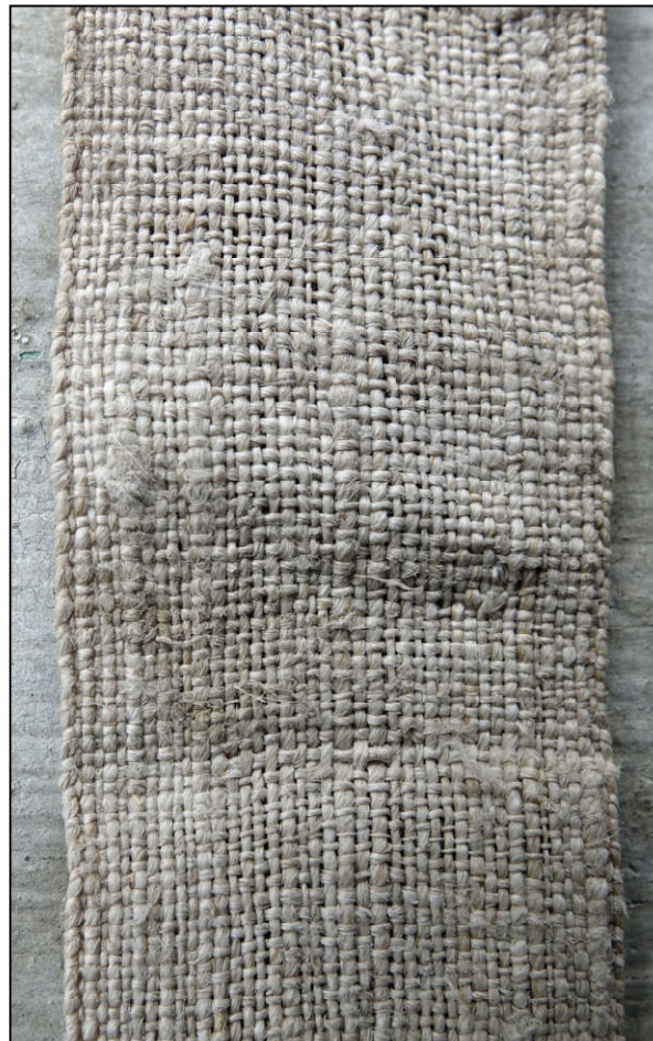
Fig. 4.5. Ruban (détail)