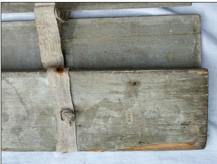
Fig. 4.7. Lame terminale