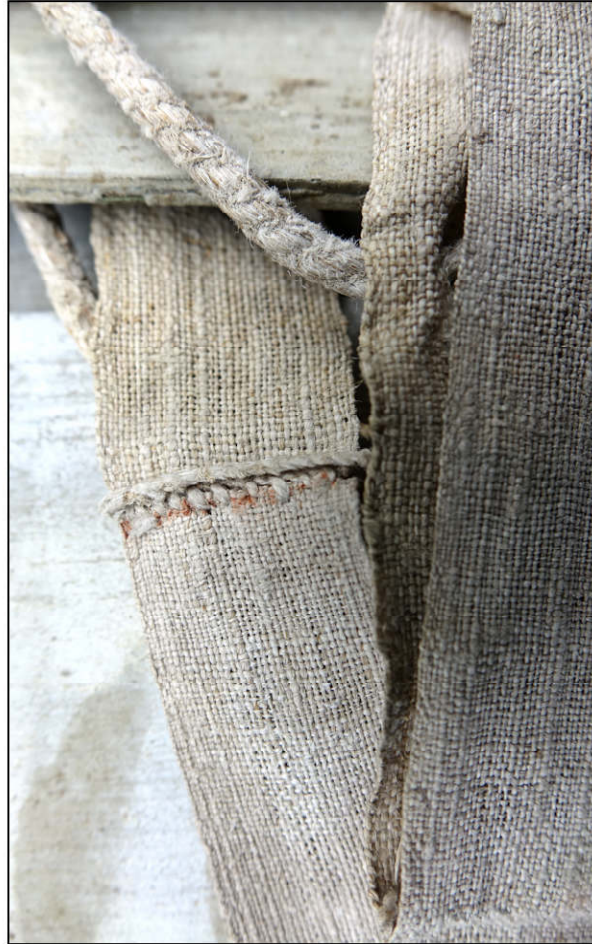
Fig. 4.2. Ruban et couture