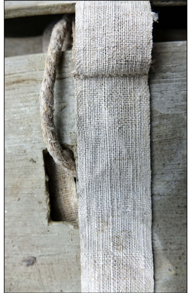
Fig. 4.3. Ruban