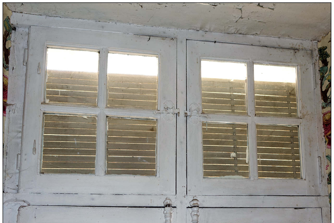
Fig. 4.4. Croisée (imposte)