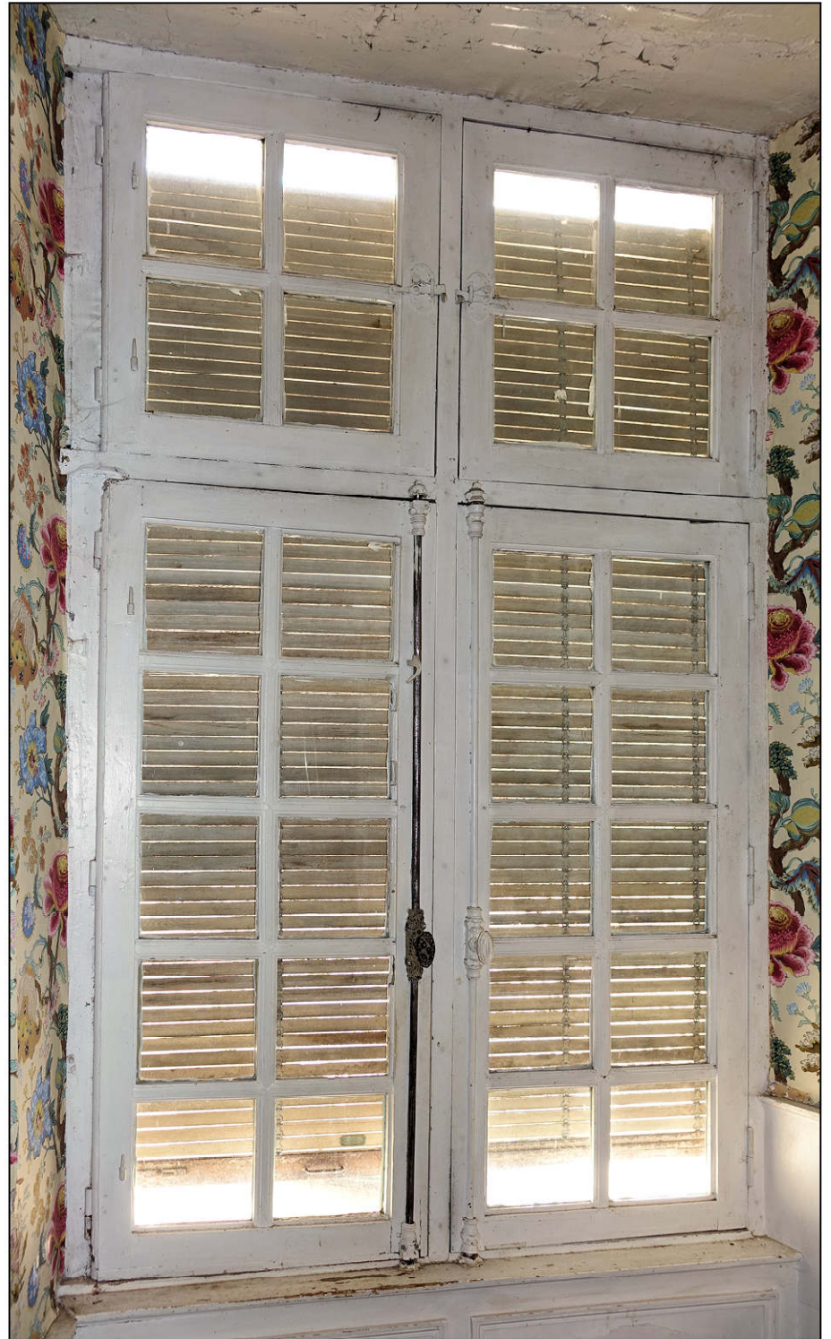
Fig. 4.2. Logis / croisée