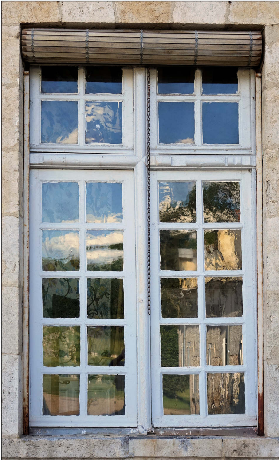
Fig. 4.1. Logis / croisée